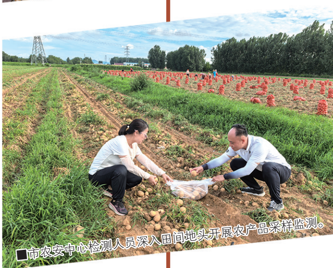
■市农安中心检测人员深入田间地头开展农产品采样监测。