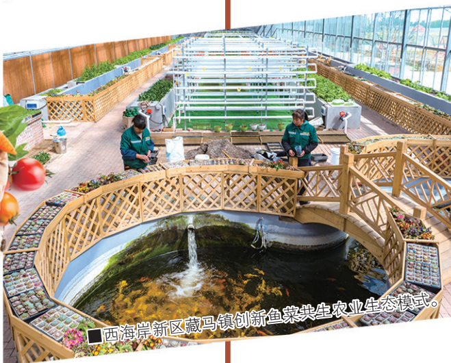
■西海岸新区臧马镇创新鱼菜共生农业生态模式。