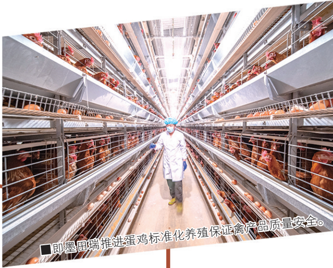
■即墨围端推进蛋鸡标准化养殖保证禽产品质量安全。