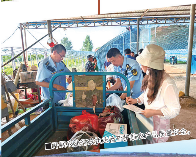
■开展农业行政执法检查护航农产品质量安全。

民以食为天,食以安为先。如果入口的东西不安全,后果则不堪设想。从吃得饱到吃得好,再到吃得健康、吃得安全,老百姓对食物的追求,折射出社会的发展与进步。社会各界对食品安全的关注,落在群众身上是关乎健康的民生大事,落在行业身上则是对生产方式、管理能力的考验。从某种意义上来说,农产品质量安全是关乎民生福祉与社会和谐的基石。