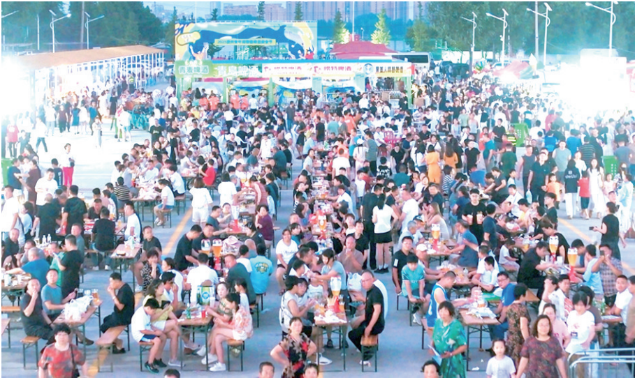
■活动现场,精酿美食引爆人气,场面火爆。

□青报全媒体记者 王逸群 陈海芹 本报7月18日讯 18日晚,2025胶州青年湖精酿啤酒美食节暨村超挑战赛在胶州青年湖畔盛大开幕。活动将创新打造“村啤”与“村超”双IP,助力胶州文、旅、体、农、商多元融合发展。 本次活动以“村啤造浪,就要不一样”为主题,由青岛日报报业集团、胶州市委宣传部、胶州市教育和体育局、胶州市商务局、胶州市文化和旅游局联合指导,胶州市三里河街道、观海新闻主办,刘家村社区承办。活动通过足球赛事聚人气、啤酒节促消费,整合胶州青年湖生态景观优势,打造“足球+啤酒”夜经济场景,营造“看着湖景喝着酒,吹着凉风踢着球”的独特文旅体验。 开幕式现场,嘉宾手持仿制“陶鬯”盛取青年湖活水浇注酒桶,用富有文化内涵的仪式拉开活动序幕。记者看到,青岛啤酒、少海精酿、上合精酿等众多知名品牌齐聚,披萨、火锅、麻辣小龙虾等各式美食潮饮齐齐