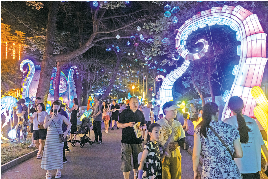
■2025年“青岛之夏”艺术灯会现场人头攒动。

□青岛日报/观海新闻记者 刘栋 本报7月18日讯 18日晚7时许,伴随着巡游队伍在中山公园精彩亮相,2025年“青岛之夏”艺术灯会正式拉开璀璨帷幕,现场人潮涌动,共赴一场山海文化光影之约。作为第三届青岛城市公园节的重要组成部分,本届灯会以“山海织绮梦 千灯映星湾”为主题,精心打造近年来中国北方夏季规模最大的艺术灯会,活动持续至10月8日。此次灯会由市园林和林业局主办,青岛报业传媒集团、自貢文旅集团与市市级公园管理服务中心共同承办,旨在为市民游客呈上一场集文化、科技、互动于一体的光影盛宴。 中山公园灯会承载着这座城市关于夏夜灯影的集体记忆。此次灯会的回归,不仅是对经典的深情致敬,更是对创新的探索。本次灯会首创“昼观林相·夜赏光影”双模式系统,通过动态光影投影、呼吸式变光装置及柔性LED交互技术,实现光影与自然肌理的实时交互。例如,“海的女儿”灯组,8米高的人物造型头发与佩戴的珍珠采用了呼吸动态变光技术,造型栩栩如生,“眼睛”开合之间尽显灵动奇幻。 灯会共设置6个主题区域,包含超大灯组10组、大型灯组14组、中型灯组16组、小型灯组21组。六大主题区域各具特色,充分满足全龄段市民游客的需求。“芳踪巡·花韵岛城”主题区域是亲子打卡的绝佳去处,机甲悟空是该区域的热门机位;“岛城帆·潮灯