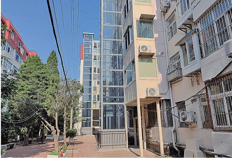
■燕儿岛路50号楼一单元、三单元加装的电梯未投用。

慢工却没有出细活。今年以来,一单元多个楼层的电梯连廊处出现漏雨、渗水等问题。电梯安装公司承诺,待电梯顺利运行后,再逐户解决漏雨问题。