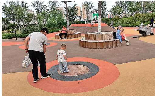
■齐鲁康体公园内的埋地蹦床破损后被填充砖块。

近日,有市民向观海新闻客户端“直通12345”平台反映,市北区齐鲁康体公园童趣乐园内的埋地蹦床损坏,相关部门采取的维修措施竟是用砖头填充,颇受儿童欢迎的蹦床变成了“硬床”。