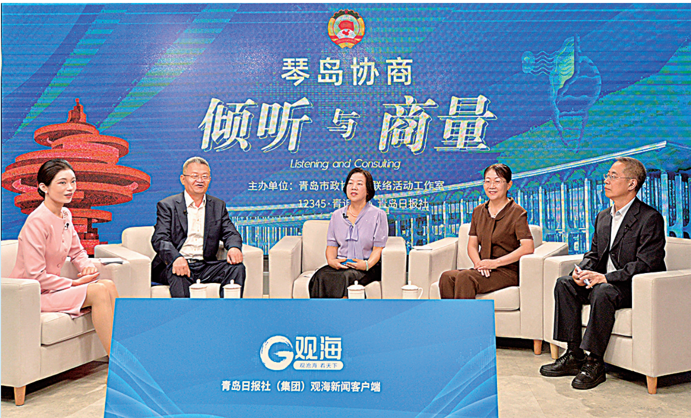
■嘉宾围绕“推动‘一刻钟便民生活圈’建设,进一步激发消费活力”主题展开协商。

舒适生活,既需要整洁优美的居住环境,也要高效便捷的配套服务。为了提升城市品质,增进民生福祉,近年来,青岛市积极推进“一刻钟便民生活圈”建设试点,加强规划引导,凝聚工作合力,不断完善便民设施功能,取得显著成效,居民幸福感、满足感明显增强。