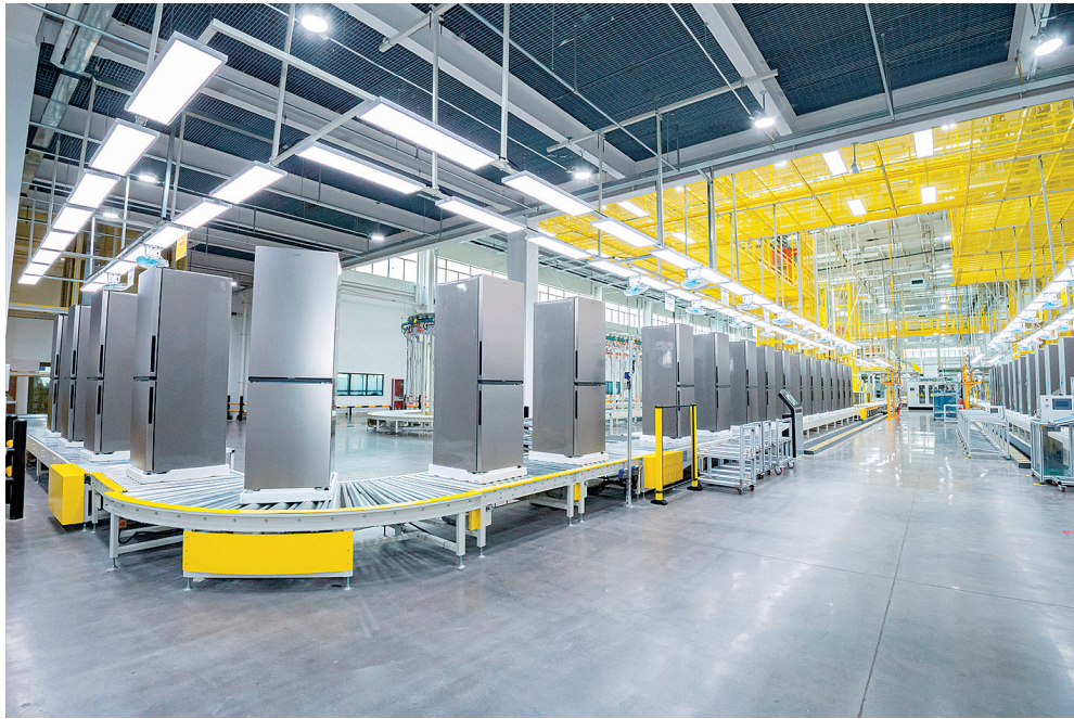
在胶州九龙街道,卡斯斯工业互联网生态园冰箱智能制造项目生产线上,一台台冰箱等待下线。

镇街和功能区是服务企业的第一线,在优化产业要素保障体系中,每个镇街、功能区因发力产业、区位优势差异,其所形成的要素保障清单各有不同,以提高培育扶持产业发展的