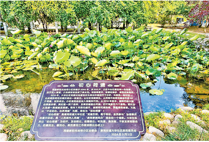
■昔日的臭水塘变身风景如画的“初心荷塘”。

在即墨老城核心区,一片被蓝鳌路、鹤山路环抱的居民区——大华社区正悄然“蝶变”。大华社区以党建为“红色引擎”,将184名党员编织成“社区党总支—网格党支部—楼栋党小组—党员中心户”四级治理网络,在15个小区、4462户居民的烟火气中,悄然激活了社区治理的“幸福密码”。