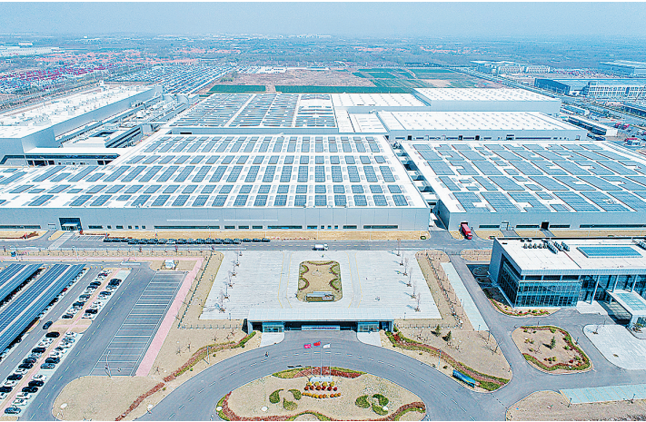
◀奇瑞汽车青岛公司厂区鸟瞰。