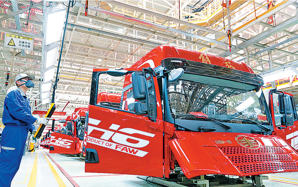
▲一汽解放青岛基地现代化生产线。

产业发展离不开好的生态。今年以来,青岛汽车产业新城以企业需求为导向,以创新服务为抓手,从政策服务、市场开拓、金融支持、人力人才保障等多个维度精准发力,持续优化营商环境,为企业发展注入强劲动力。