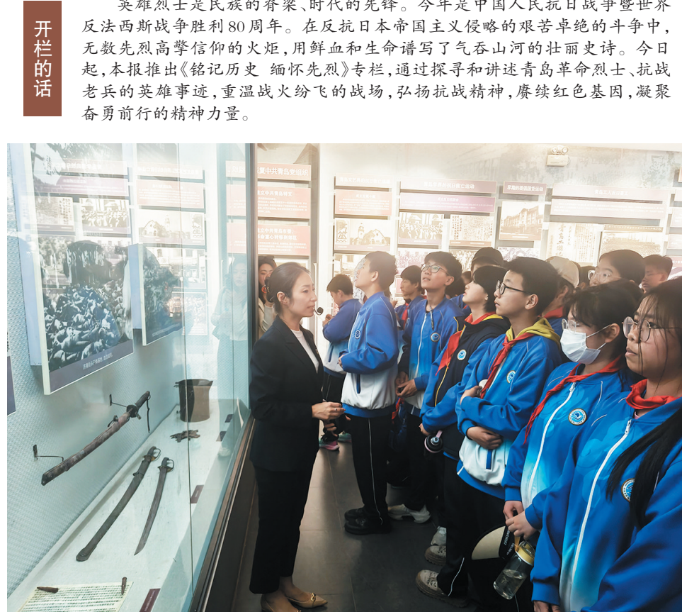
近日,青年学生在青岛市革命烈士纪念馆抗战馆参观。

青岛是我国唯一经历了两次世界大战战火洗礼的城市,在历史上两次遭受日本军队侵占,时间长达 16 年之久。