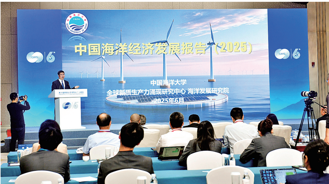
第六届跨国公司领导人青岛峰会举行研究成果发布专场。

青岛吸引外资的“硬”实力向来有目共睹:外资企业数量占全省总数近四成,179家世界500强企业