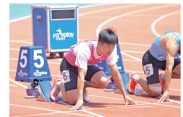
■苏炳添出战男子100米预赛。

□青岛日报/观海新闻记者 许诺 本报6月18日讯 18日上午，2025年全国田径大奖赛（第五站）在青岛国信体育中心体育场拉开帷幕。亚洲“飞人”苏炳添出战男子100米预赛，最终以11秒37的成绩无缘半决赛。走出赛场，苏炳添表达了对现场观众的感谢和对青岛这座城市的喜爱，“第一次来青岛，感觉这座城市很国际化。现场观众非常热情，非常感谢大家对于中国田径的支持。”