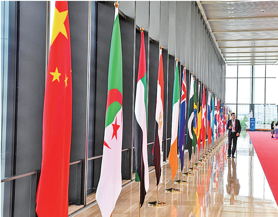
第六届跨国公司领导人青岛峰会于19日在青岛国际会议中心开幕。