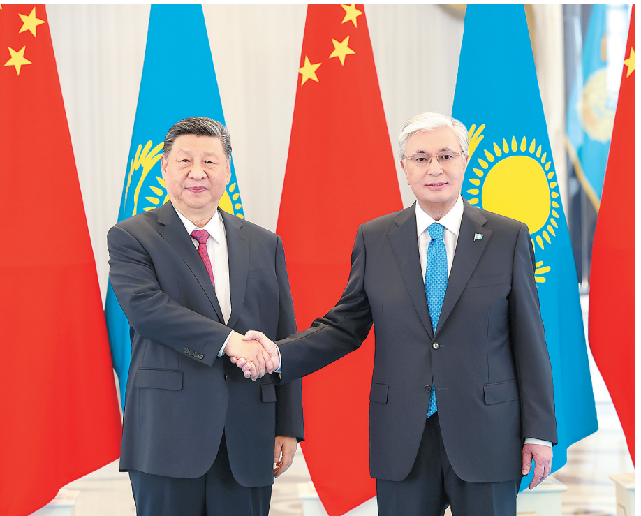
当地时间6月16日下午,哈萨克斯坦总统托卡耶夫同中国国家主席习近平在阿斯塔纳总统府举行会谈。