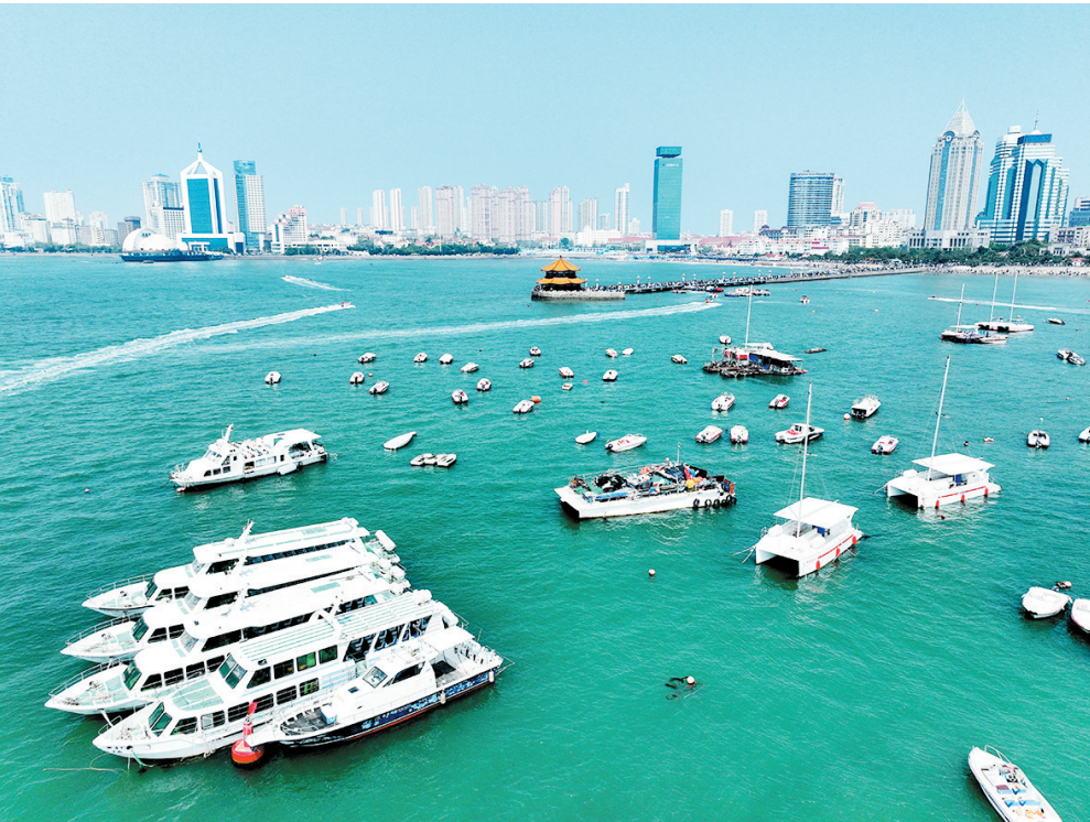
市民游客在青岛湾栈桥码头体验“海上游”。

意识提升等均成为影响市场快速演进的关键变量,这从国际性海洋旅游目的地的市场布局可以窥探一二。