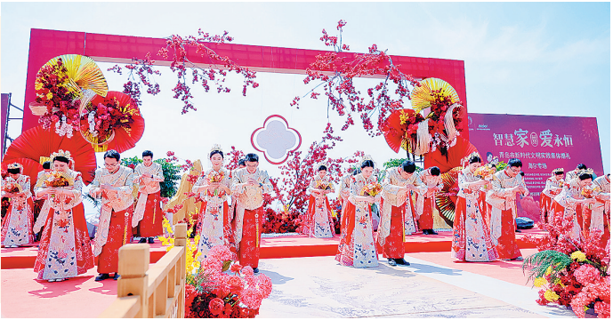
■2025年青岛市新时代文明实践集体婚礼(海尔专场)。

同时,依托“文明实践,德耀崂山”文明实践品牌,崂山区列出“居民需求清单”“社会资源清单”“项目服务清单”,每年开展文明实践志愿服务近万场,全区注册志愿者超10.9万人,志愿团队1500余个,绘就了一幅“阵地全域覆盖、活动全民参与、文明全域浸润”的新时代文明实践生动图景。