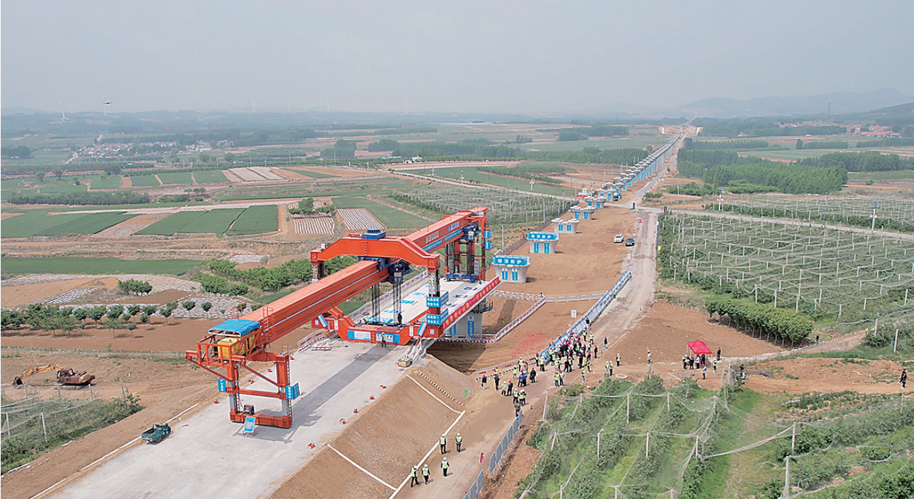
■5月7日,潍宿高铁至青岛连接线完成首孔箱梁架设。

海通道的连接线,也是山东规划鲁中高铁通道的组成部分,是未来青岛都市圈南下长三角的一条关键通道。项目位于山东半岛南部,途经青岛市、潍坊市、日照市,自青盐铁路洋河口站引出,引入潍宿高铁新建五莲北站,全长108.78公里,总投资237亿元,由山东铁投集团投资建设,设计时速350公里。全线设洋河口、青岛西、诸城南、五莲北4座车站,于2023年12月开工。