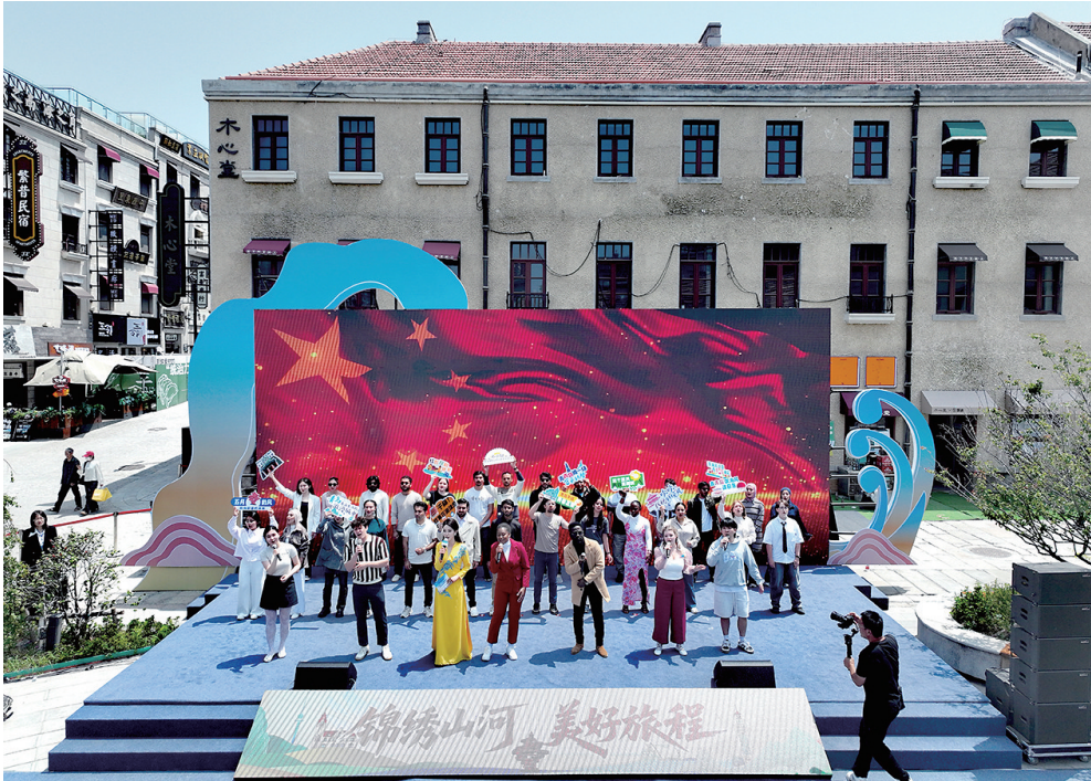
■2025“5·19中国旅游日”青岛市活动启动仪式现场,留学生们表演了精彩的文艺节目。

乘太平山索道俯瞰全城,电影《送你一朵小红花》同款浪漫直接拉满;在小鱼山顶和老舍的散文诗隔空击掌;转角遇见大学路网红墙,红墙黄瓦配咖啡香;漫步中山路历史文化街区,里院建筑与光影艺术展碰撞,历史与潮流在此对话;夜幕降临时,大鲍岛文化街区霓虹闪烁,复古街巷变身露天艺术馆。 线路三 怦然心动·青春爱恋甜蜜 在方特梦幻王国的烟火中享受浪漫一夏;在海誓山盟广场,白纱与誓言交织出满仪式感;潜入安娜别墅的玫瑰花瀑布,文艺书店里藏着告白的终极灵感;牵手漫步情人坝,许下爱的誓言;漫步海之恋公园,和可爱小狗们一起撒欢;登上极地之光摩天轮,在66米高空俯瞰最美海湾。 线路四 笑浪青春·文化狂欢沉浸 去城阳开心麻花大剧院笑出腹肌,治愈所