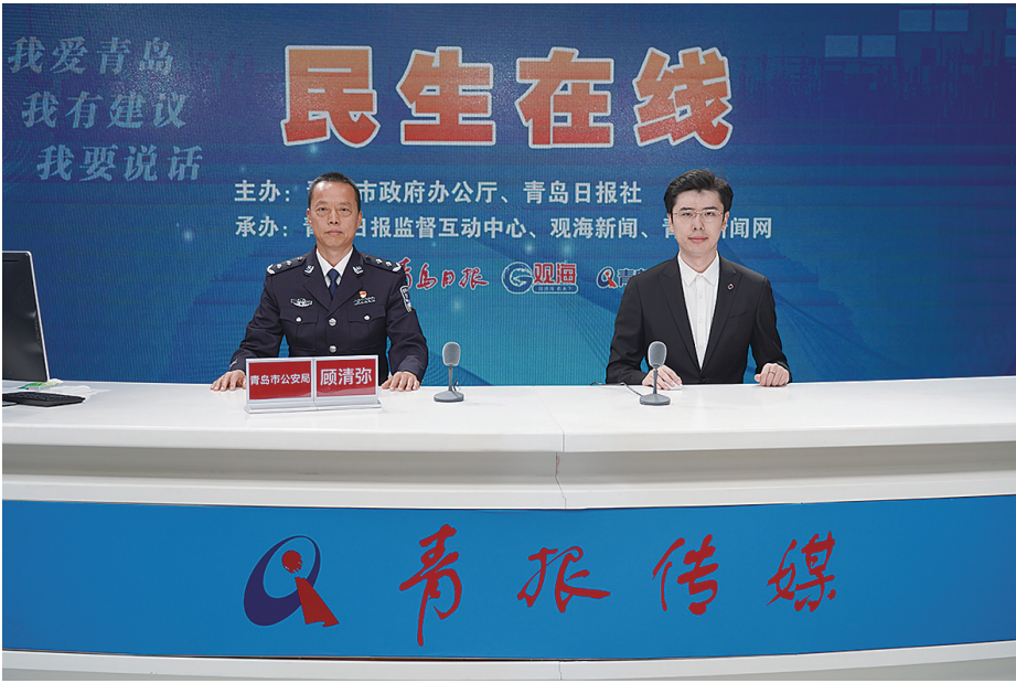
■市公安局党委副书记、政委顾清弥做客民生在线。

顾清弥： 近年来，青岛公安机关针对老年人的非法集资或集资诈骗活动采取了打防并举等系列工作措施。对打着“养老服务”“健康养老”等旗号，以“高利息、高回报”为诱饵的养老领域非法集资犯罪进行严厉打击，坚持“打早打小、露头就打”。组织开展“金融