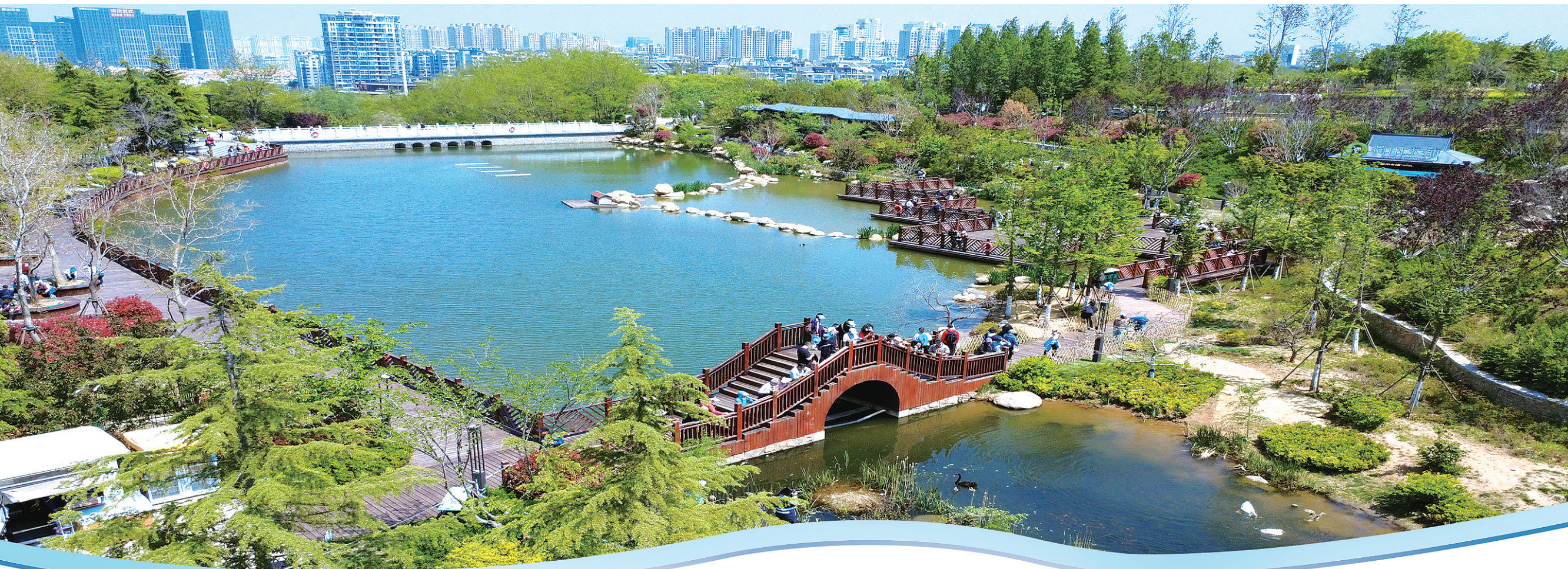
■“五一”期间，浮山森林公园的生态美吸引了众多市民和游客。