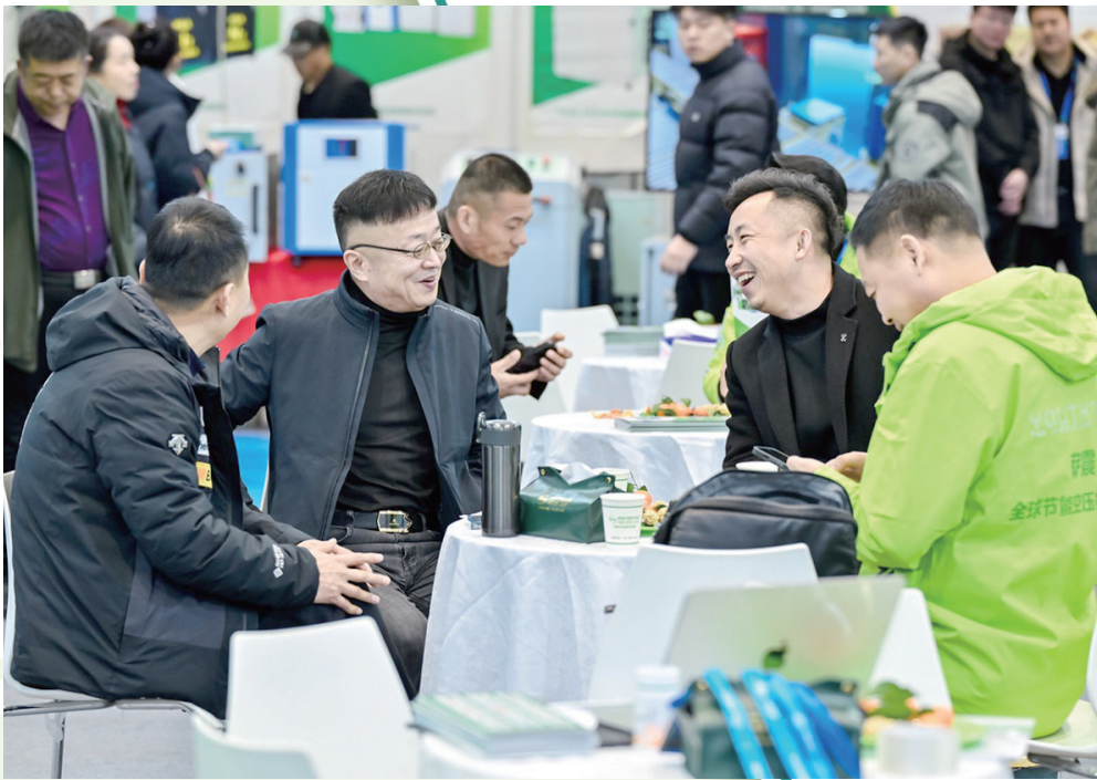
■第22届青岛国际金属加工设备展览会搭建展示技术、洽谈合作的平台。