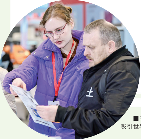
■在青举办的高能级展会吸引世界各地的采购商参加。

经贸对接： 今年，青岛市贸促会计划在青举办中韩造船行业对接会、海牙市新能源企业对接洽谈会、韩国-山东保健医疗合作交流会、中日老龄产业对接会、罗马尼亚-山东商务对接会等近10场经贸对接活动