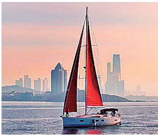
■全国第一艘红帆船亮相青岛。