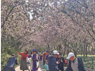
■李村公园内海棠花开成海，吸引了众多市民游客打卡。