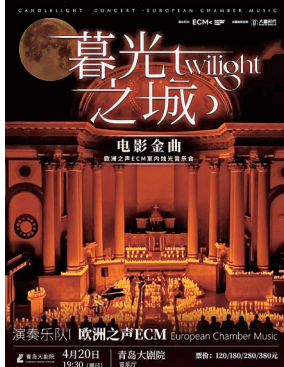
■“欧洲之声”六人室内乐团烛光音乐会海报。