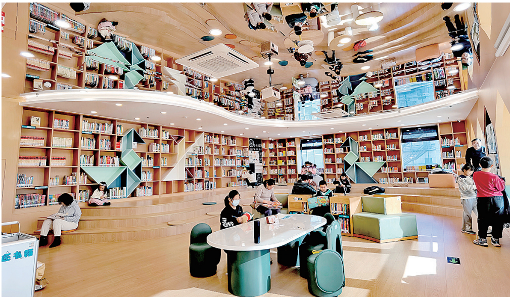
崂山区图书馆创新园分馆。

四月芳菲,正是读书好时光。一处处公共文化空间如雨后春笋般出现,体现着青岛这座城市厚重的文化底蕴和暖心的人文温度。作为近年来兴起的新型公共文化空间,覆盖青岛十区市的“城市书房”,更是成为市民游客走进城市文化生活,触摸青岛文化脉络的美好之境。