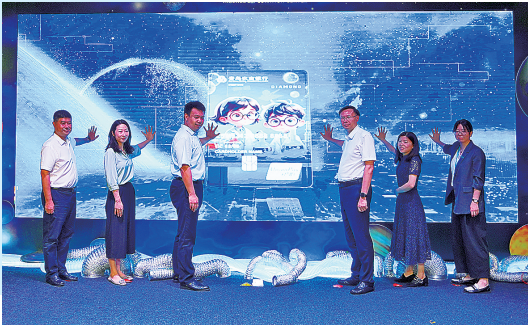
■2024年7月，青岛农商银行发布“小小科学家”钻石信用卡，布局亲子消费场景。

频生活场景，以营业网点周边“一刻钟便民圈”建设为切入点，通过场景化产品创新和数字化服务升级，全面激活社区消费活力。其业务覆盖交通、商超、医疗、文旅等民生领域，形成了“触手可及”的便民服务生态。