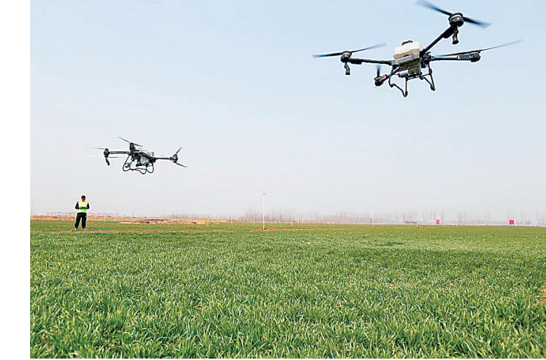
■青岛保险机构利用现代科技手段助力春耕备耕。

为护航春耕备耕，青岛金融监管局积极提示督导小麦防灾减损服务，多次向农险承保机构转发青岛自然灾害风险形势分析和防范建议，特别是今年2月底寒潮天气发生前，