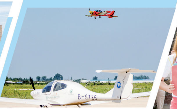
■位于莱西市店埠镇的青岛莱西通航产业园。