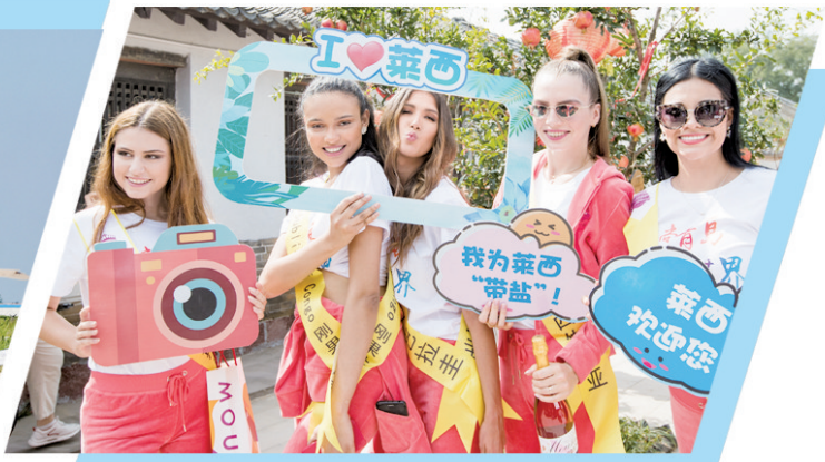
■外国游客在莱西市水集街道产芝村游玩。