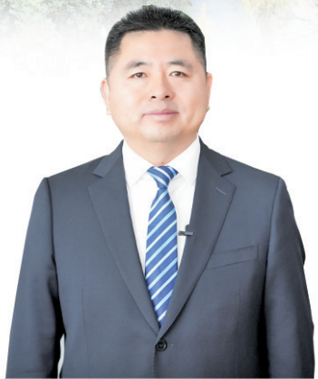
莱西市委书记周科