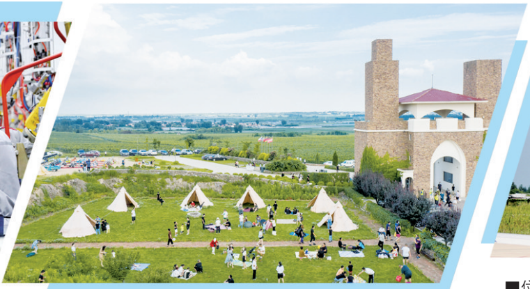
■莱西市院上镇九顶庄园露营基地。