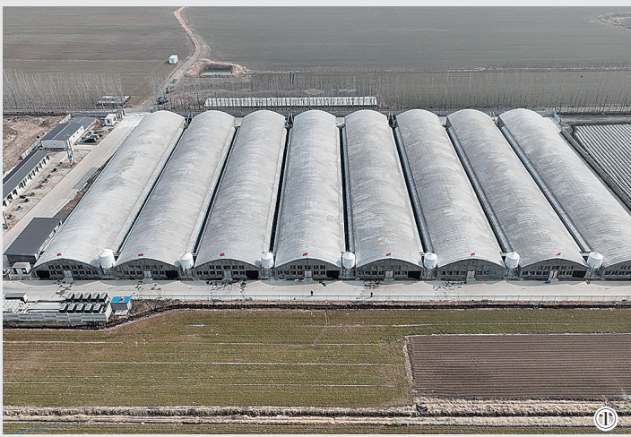
■①②莱西市店埠镇的现代农牧科技项目,一个养殖周期可喂养35万只白羽鸡。

项目(国信2-2号)、清水湾数字农业综合服务中心等项目,则显示出青岛在智慧农业、现代设施农业方面的“优等生”位次,也将成为青岛发展现代都市农业的重要点位。