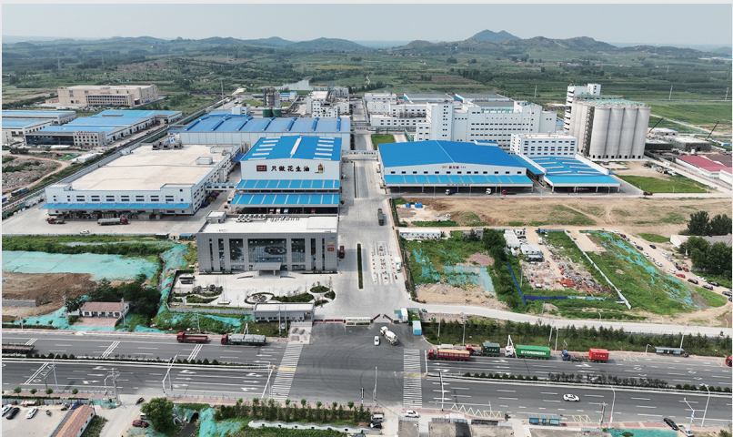
■益海嘉里(青岛)食品工业园。