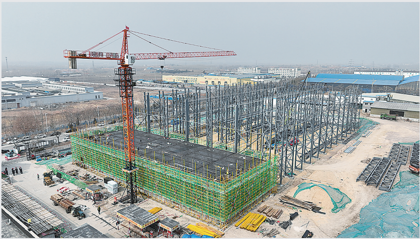
■建设中的青岛万福集团智能化立体冷库项目。