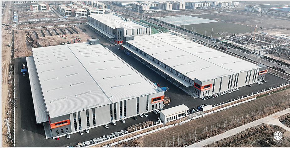
■③位于平度市南村镇的高端食品产业园项目。