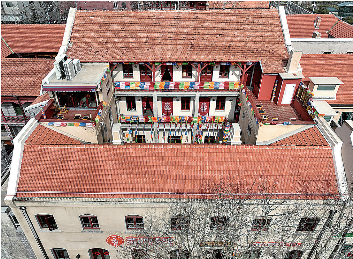
■位于高密路3号里院的文布嘉措西藏艺术空间，成为游客沉浸式打卡藏式风情的诗和远方。