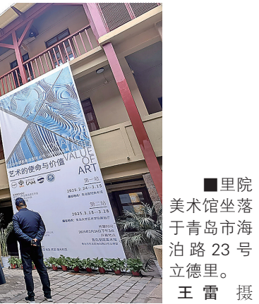
■里院美术馆坐落于青岛市海泊路23号立德里。

在青岛不必远足，就可以感受浓郁而正宗的藏地文化。大鲍岛街区里，此处精心复刻的藏地文化空间闹中取静，成为市民休闲度假的网红打卡地。拍摄藏族风情的写真照、描唐卡、品尝糌粑和奶茶以及融合多地美食的创意时尚宴席，让前来体验的市民与游客犹如挖到了一处宝藏。“这是一个可以来了再来的打卡地，每个季节、一天中的每个时段都有不同的风景，每次来即使是简单地看云卷云舒，都有不一样的视觉体验与文化感知。”市民章女士是这处文化空间的铁杆粉丝，没事