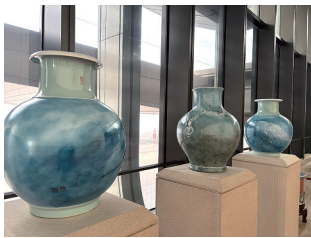
■青岛国际会议中心内展示的艺术瓷。