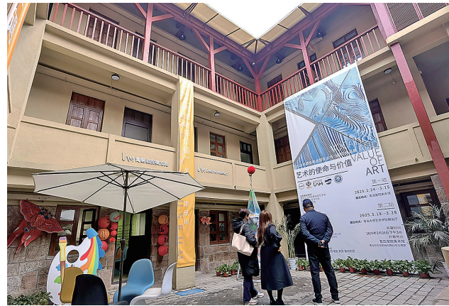
■里院美术馆坐落于青岛市海泊路23号立德里。

一座文旅新地标、一处文化艺术空间，所谓“长期主义”，就是光“建好”还远远不够，更要运营好它。例如，武汉通过提炼老城的城