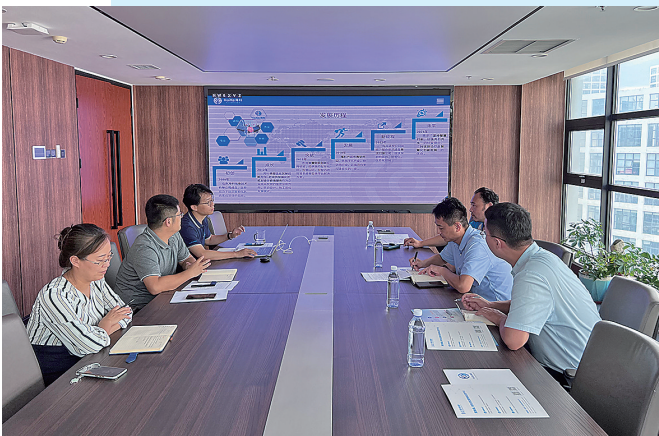
市北区科技局走访山东海科信息技术有限公司。