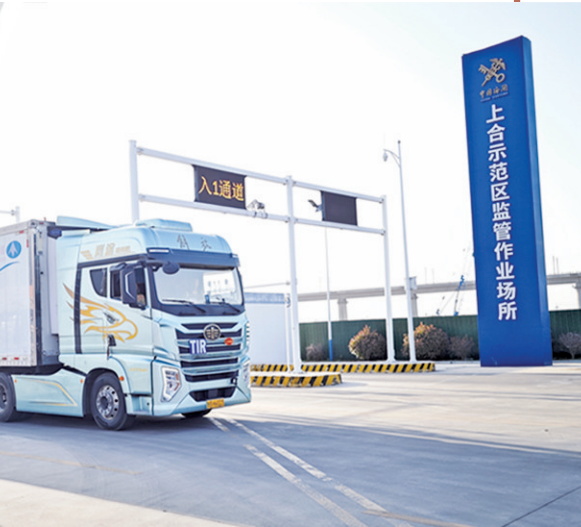
■一辆TIR运输车辆驶出上合示范区监管作业场所。