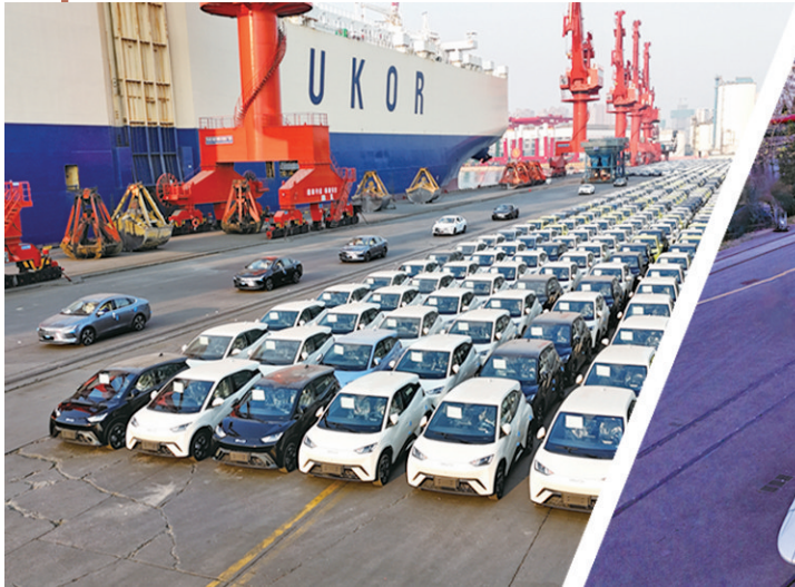
■数千辆国产新能源汽车在山东港口青岛港大港码头待装出口。

这份报告,内容丰富,看点很多。今年十个方面的重点工作,涉及扩大内需、产业体系、科技创新、深化改革、扩大开放、乡村振兴等方方面面。对于青岛而言,报告中蕴含着重大机遇,也包含着使命责任。