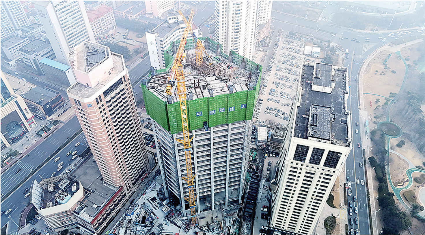
■航运贸易金融总部大厦项目施工至105米高度,建成后将为浮山湾畔再增一座活力新地标。

超高层建筑是对城市空间的集约化利用。项目地上部分分为顶层住宅区、中层办公区、底层商业区。其中,办公区依托优势区位,高端空间营造,积极吸引金融业、航运商贸业、现代服务业、时尚产业等多种新型高端业态,将对青岛市高端服务业的集聚产生示范带动作用。商业区将引入全球范围内的新型潮流业态,将成为青岛高端时尚休闲目的地,同时形成一个充满活力的步行公共空间和一条通向大海的新大道。