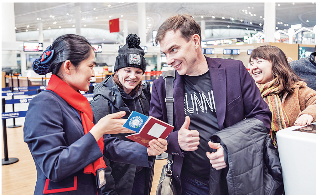
青岛机场工作人员为外籍旅客提供咨询服务。

此前,青岛为山东省内唯一144小时过境免签城市。随着240小时过境免签政策的实施,越来越多的外籍旅客选择来山东观光旅游、探亲访友。青岛机场出入境边防检查站统计数据显示,政策实施两个多月(2024年12月17日至2025年2月26日)来,青岛机场口岸出入境外籍旅客达到18.2万余人次,同比增长61.3%。从