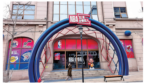
NBA《全情投入》世界巡回主题展正式落地青岛中山路18号。