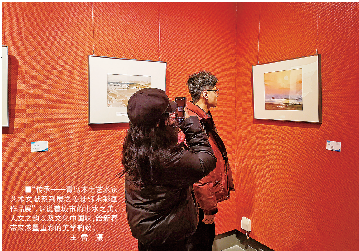
“传承——青岛本土艺术家艺术文献系列展之姜世钰水彩画作品展”，诉说着城市的山水之美、人文之韵以及文化中国味，给新春带来浓墨重彩的美学韵致。