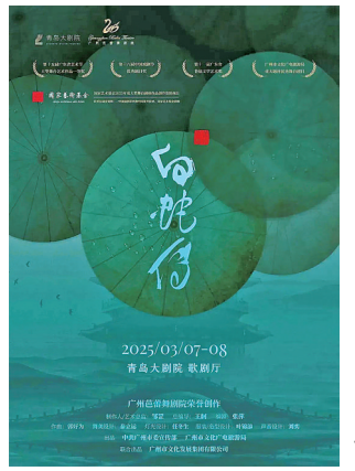
芭蕾舞剧《白蛇传》海报。