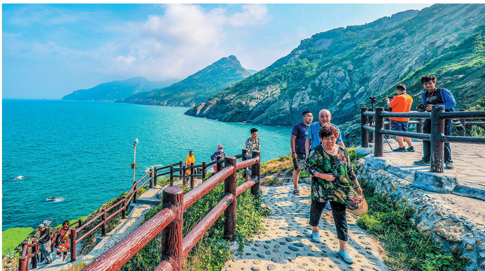
市民游客在西海岸新区灵山岛游玩。(资料图片)

今年的市政府工作报告提出,提升文化旅游品质,深化海岛旅游开发攻坚。竹岔岛的消息传来,让人们对于海岛旅游发展的新图景期待值“拉满”。通过科学规划,有序推进海岛旅游度假产品开发,形成具有本土特色的高端海岛旅游度假品牌,无疑将为青岛打造国际滨海旅游目的地、培育时尚文旅消费