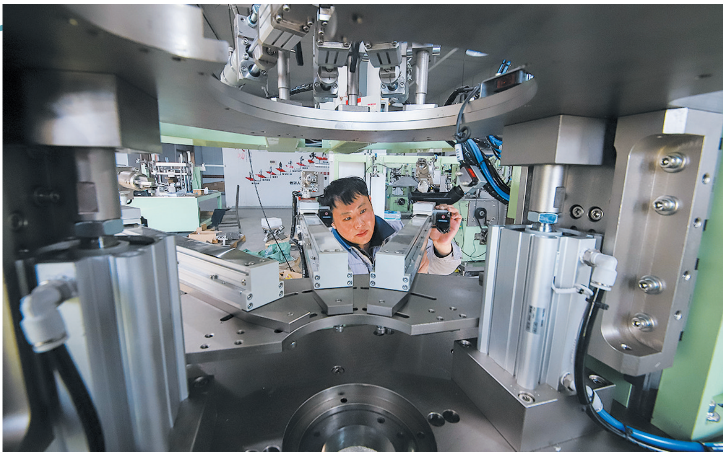
■2月5日，在李沧区一家智能装备企业，工人在车间组装电机设备。

立春万物苏，勤耕启新程。 新春的喜庆氛围还未散尽，全市企业已按下“快捷键”，开足马力加快生产，奋力冲刺“开门红”，为新一年的经济发展注入强劲动力。