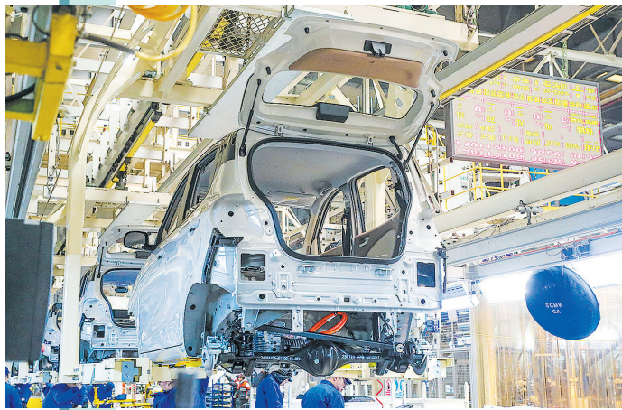
■2月5日，上汽通用五菱青岛分公司生产线组装有条不紊。