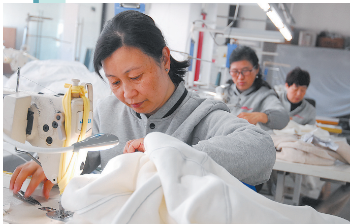
■2月5日，即墨区一家纺织企业工人在生产出口服装。