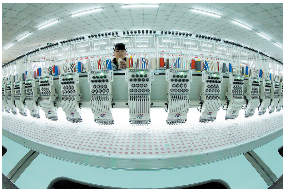
■2月7日，即发集团的绣花生产线加足马力赶订单。