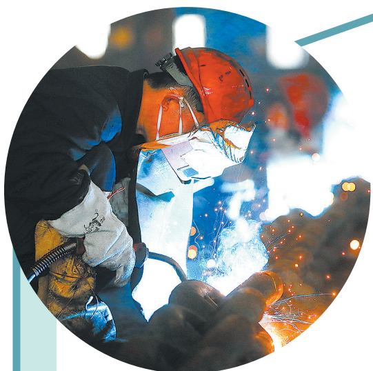
■2月5日，青岛锚链股份有限公司员工加紧生产出口海外市场的锚链产品。