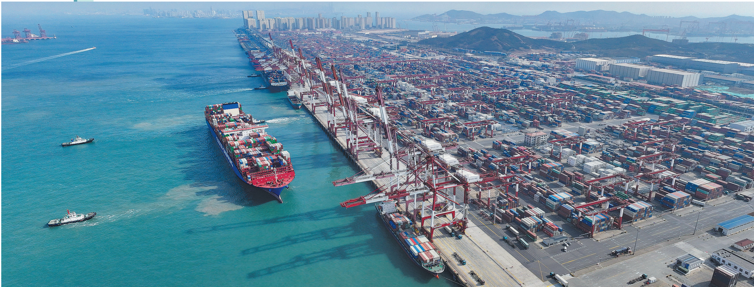
■2月11日，山东港口集团青岛港前湾集装箱码头货物装卸作业繁忙有序。