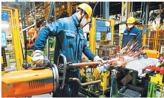
■2月1日，在山东自贸试验区青岛片区柳州五菱汽车山东分公司，生产线工人在生产零部件。