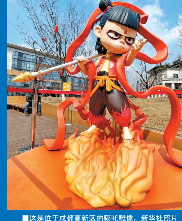
■2月10日,墨境天成成都数字图像科技有限公司的工作人员在制作动画效果。