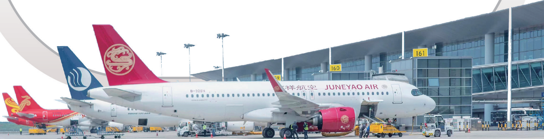
■青岛机场客运航线可通达128个国内外城市。

青岛胶东机场海关统计显示,2024年,经青岛空港“空空联运”转关吞吐量达1.24万吨,同比增长36%。青岛啤酒酒液鲜原浆、湖北小龙虾、云南纯天然野生松茸等国产“潮牌”产品频频登上飞机,经青岛机场飞往全国乃至世界。