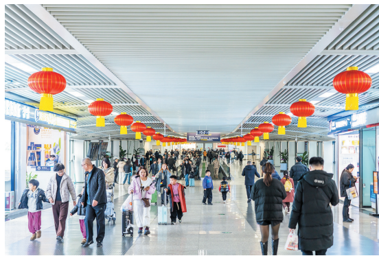
■繁忙的胶东机场航站楼。

铁路日照西站所在的东港区是青岛都市圈16个县(区)之一。2024年10月,位于日照西站商旅服务中心的青岛机场日照城市航站楼启用,实现了航空与高铁的“一站式”无缝衔接。自日照西站前往青岛24小时内航空出行的旅客,可享受免费的“一站式”航空服务及舒适温馨的候车环境,从现场值机、候车休息到乘