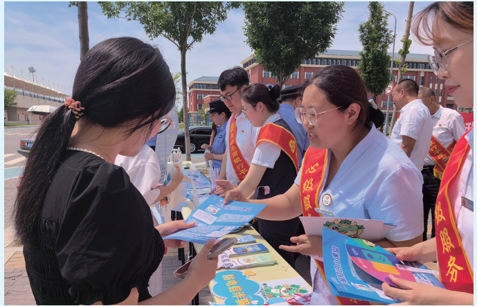
■筑牢反诈“防护墙”，增强人民群众防诈识诈能力。