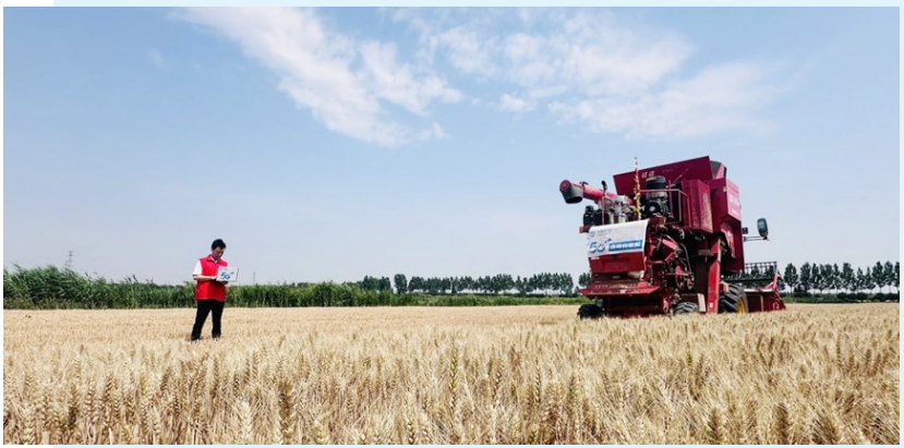
■打造5G智慧良田，助力乡村振兴。