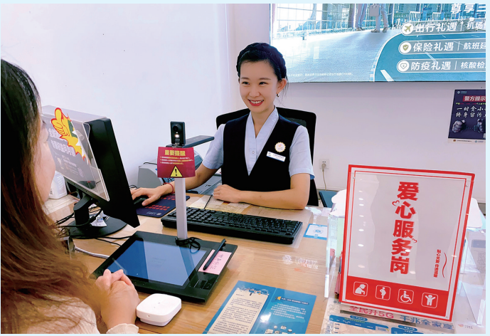
■提升精细化服务能力，做优“心级服务”品牌。