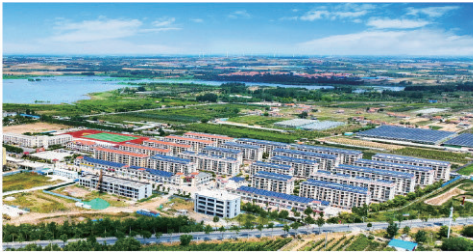
■积极推进新型电力系统建设,新能源装机容量突破850兆瓦。

调、牵头抓总,制定部门、镇街两张“重点关注问题清单”,建立“以数据做分析——以分析找问题——从问题求突破”的工作机制。2024年,组织经济形势分析会议20余次,对重点单位进行全方位指导。