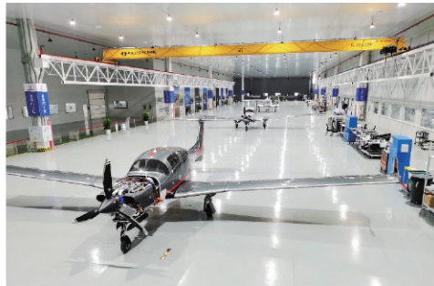
■低空经济“链主”企业万丰DA50钻石飞机下线。

莱西市坚持项目全生命周期管理,建立健全“开工、纳统、投资”三张清单,加大产业链招商、