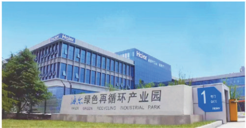
■莱西市废旧家电回收拆解再利用闭环体系建设案例入选国家“双碳”典型案例。