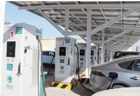
■规划布局充电基础设施,不断提升“镇镇通”服务能力。

2024年6月,姜山镇入选青岛市共同富裕先行先试特色乡镇(街道)名单,全力打造居民乐业增收促共富领域特色乡镇,将力争用3年左右时间,取得一批标志性、突破性、创新性成果,探索更多可复制可推广的共同富裕路径和模式。这是莱西市经济建设高速推进和高质量发展的生动写照。在这背后,莱西市发展和改革局充分发挥参谋助手作用,敢于统筹协