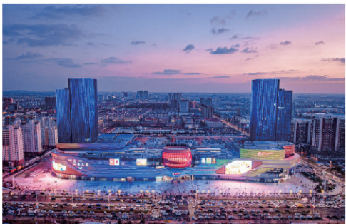
■省服务业重点项目——王府井购物中心投入运营。

莱西市发展和改革局作为莱西市宏观经济发展的管理部门,聚焦经济建设和高质量发展,因势而谋、乘势而上,发扬“事事敢争先、处处争一流”的发改精神,持续强化经济运行统筹协调,交织出创新改革的强大韧劲,汇聚起高质量发展的澎湃动能。