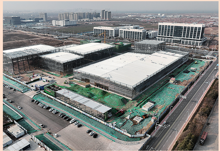
■瑞幸咖啡创新生产中心项目。