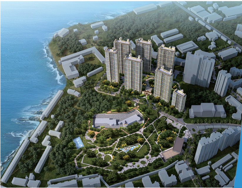
■青铁·云上观澜效果图。