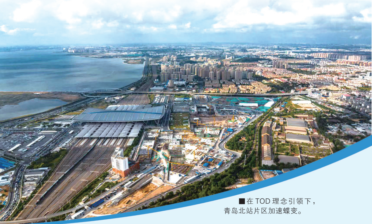
■在TOD理念引领下，青岛北站片区加速蝶变。