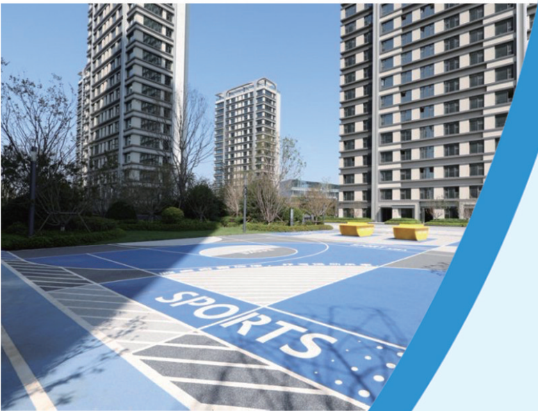
■青铁·云上观海实景图。