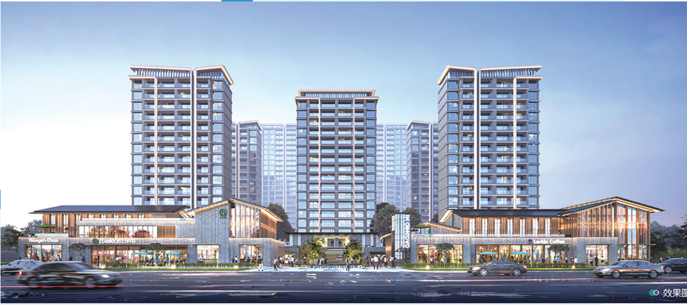
■青铁·芳华地效果图。