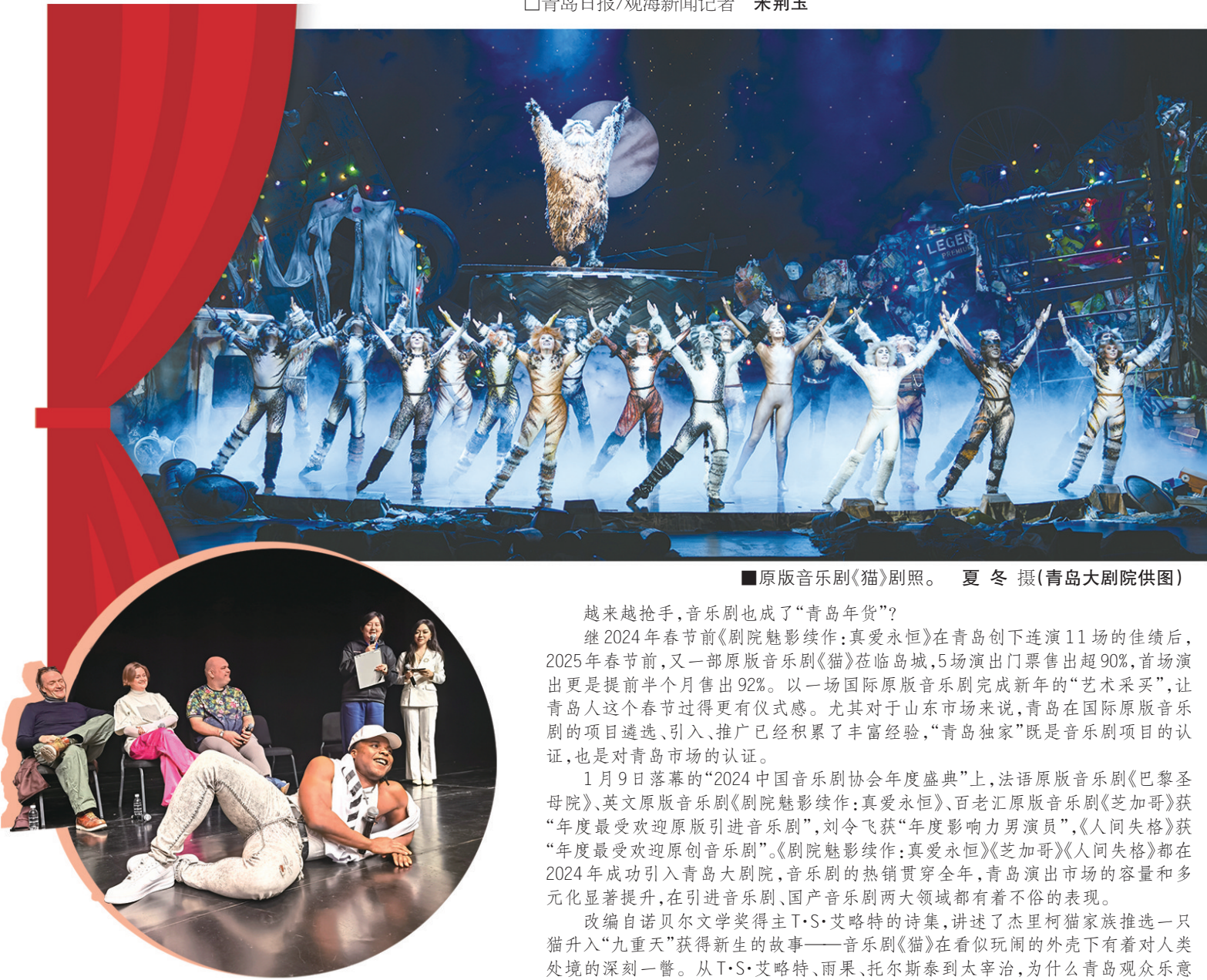
■原版音乐剧《猫》剧照。