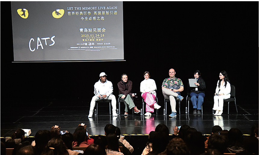
■音乐剧《猫》主创与岛城观众分享“猫经”。

来自剧院的信息显示,海外优质音乐剧往往需要提前一年左右开始对接,国内热门剧目也非常抢手。以今年1月爆红的国风音乐剧《锦衣卫之刀与花》为例,该剧首轮就遭各个城市争抢。“红楼梦”题材音乐剧《宝玉》在中国音乐剧盛典上演了15分钟片段,首轮演出集中在上海、成都、苏州等城市。站在剧迷的角度来看,在家门口看热门剧目机会难得。一方面,《阿波罗尼亚》《新龙门客栈》为代表的沉浸式音乐剧有固定驻演剧场,极少离开所在城市;另一方面,优质项目的演出场次越来越多,对剧场的要求越来越高。剧迷就音乐剧的市场走势坦言:“一些好剧如果青岛不接,山东就看不到了。”