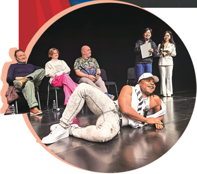
■见面会上,“摇滚猫”现场表演剧中经典动作。

1981年首演的《猫》堪称史上最成功的音乐剧之一,迄今仍然是百老汇演出场次第五、伦敦西区演出场次第七的经典。《猫》在日本、韩国的演出直接成为亚洲音乐剧发展史上的标志性事件,日本著名的四季剧团有《猫》的专用剧场,韩国音乐剧更是深受《猫》的影响。中文版《猫》作为《猫》的第15个语种版本,也见证了经典音乐剧如“猫”一般一步步落地中国、亲近中国观众的过程。