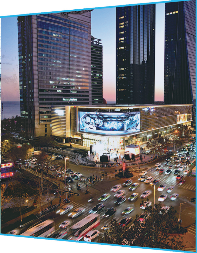
■市南区的绿城GT PLAZA商业项目。