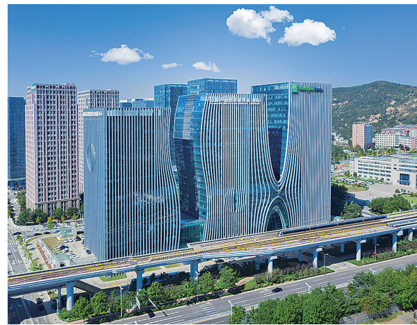
■崂山区的青岛市人工智能产业园。