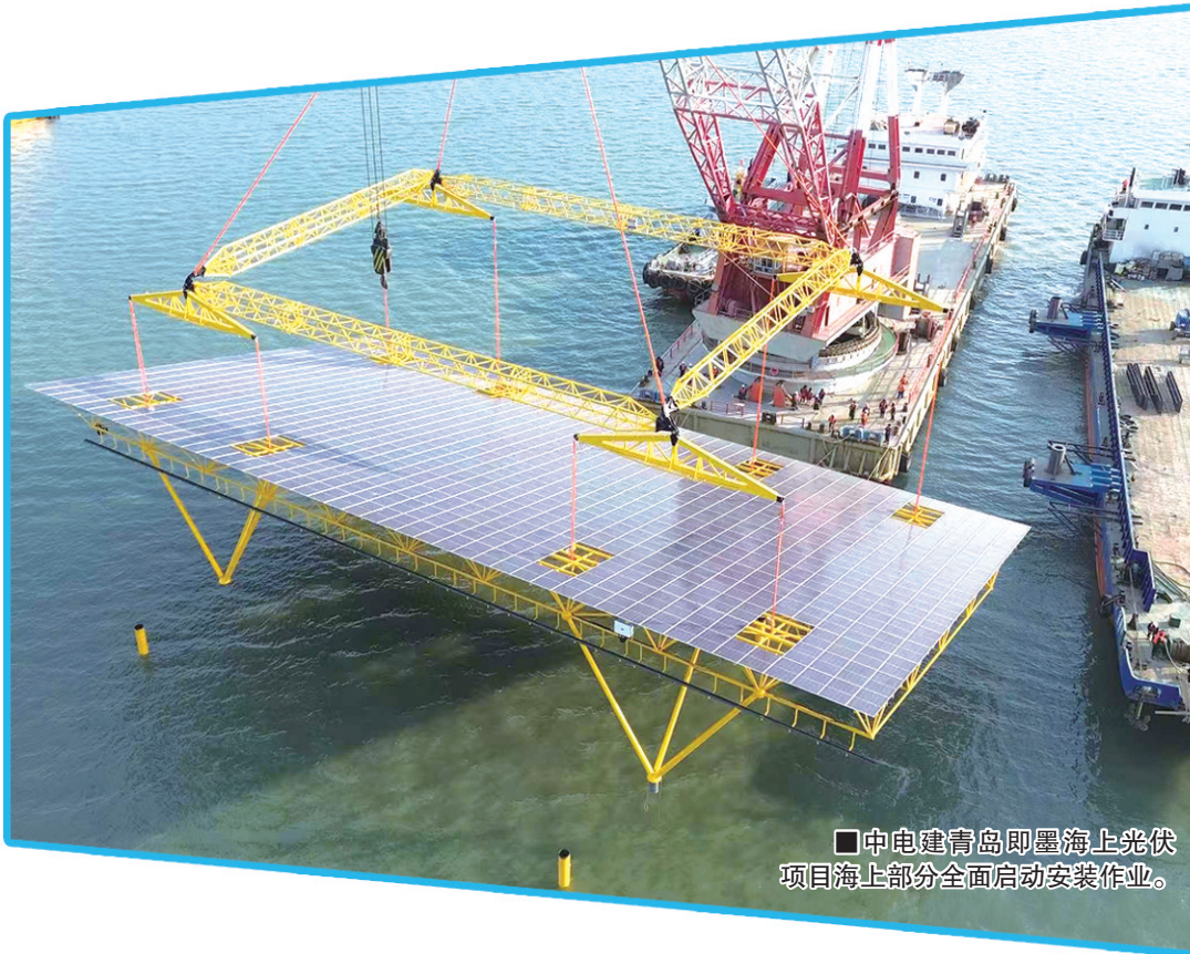
■中电建青岛即墨海上光伏项目海上部分全面启动安装作业。

县域经济是中国的基本单元，也是促进区域协调发展的重要环节。这一份份简洁却不简单的政府工作报告，透露出在过去的一年中，青岛十区（市）守正创新，不断增强发展张力和韧性。在2024年印发的《山东省县域经济高质量发展试点工作方案》中，青岛三个区（市）入选“引领发展试点县域”名单，是全省入选该领域试点区县最多的城市。在不同机构评选出的全国“百强县”“百强区”名单中，青岛多地榜上有名。