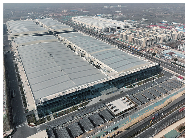
■胶州市的海尔卡奥斯工业互联网生态园内，卡奥斯冰箱一、二期项目已顺利投产。