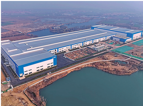
■城阳区的鹏辉能源项目。