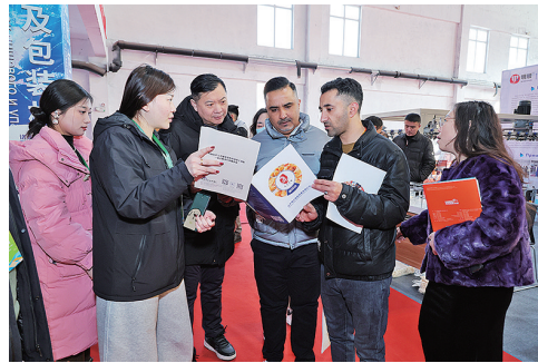
1月16日，在“好品山东 鲁贸全球”上合组织国家食品机械精准采购对接会上，国内外企业参展商精准对接、密切交流。

中央组织部印发通知，要求各级组织部门组织党员认真读原著、学原文、悟原理，将《概论》作为教育培训的教材和学习的必读书目，更加深刻领悟“两个确立”的决定性意义，增强“四个意识”、坚定“四个自信”、做到“两个维护”，自觉在思想上政治上行动上同以习近平同志为核心的党中央保持高度一致，奋力开创党的建设和组织工作新局面，为以中国式现代化全面推进强国建设、民族复兴伟业提供坚强组织保证。