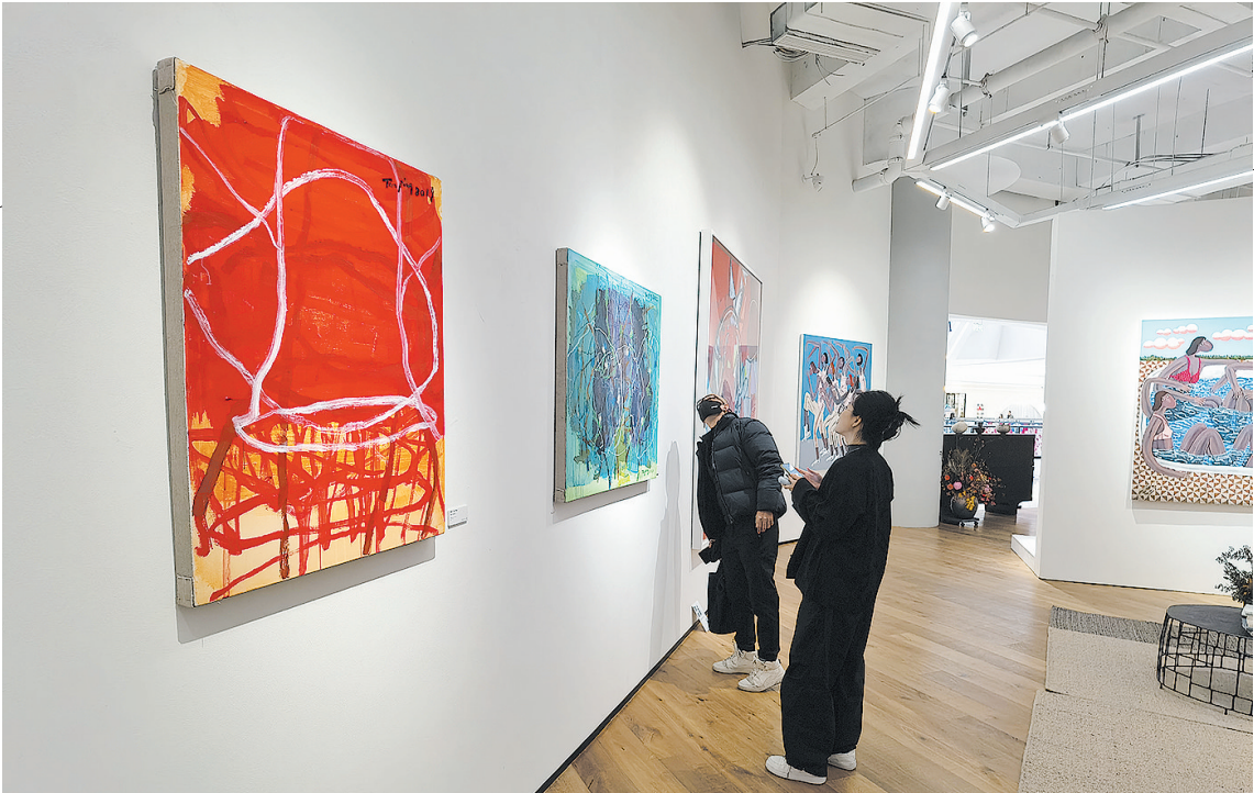
■“入屋”，打造艺术、时尚与生活方式的融合空间。