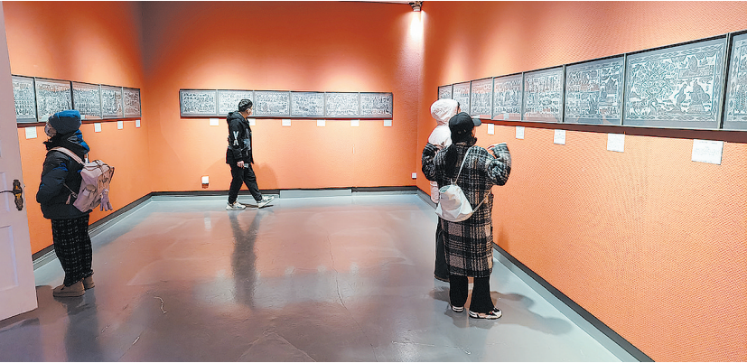
■青岛市美术馆不断推出新展吸引市民游客参观。

春节意味着万紫千红的春天即将到来，展览上的画作，花瓣飘落的轻盈舞姿、麦浪翻涌的灵动之态、猫咪跳跃的俏皮模样、百灵啼鸣的悦耳之音，皆跃然纸