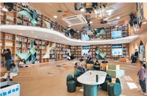
■崂山区图书馆创新园分馆内景。