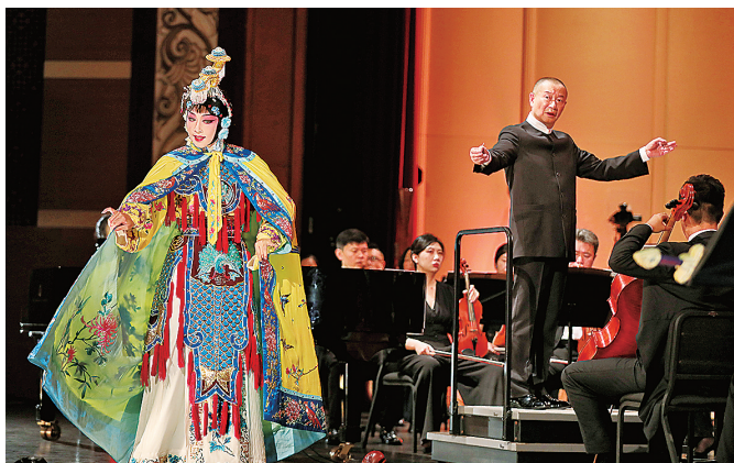
■谭盾音药周给市民游客带来交响乐与京剧的完美糅合。