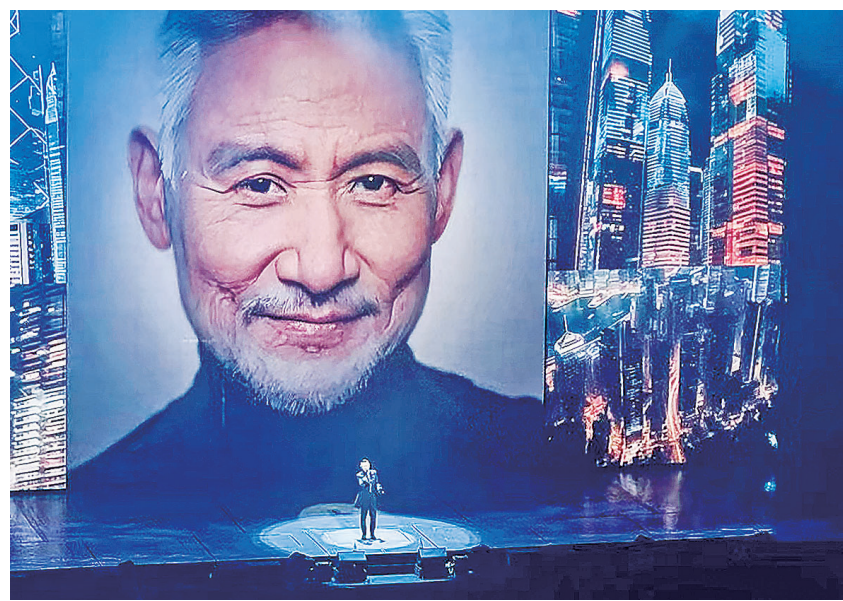
■张学友“60+”世界巡回演唱会在青岛市民健身中心体育馆开唱。