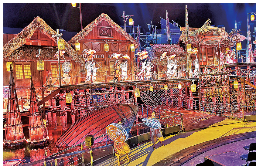
■360°全景秀《海上有青岛》开启跨越时空的文化之旅。