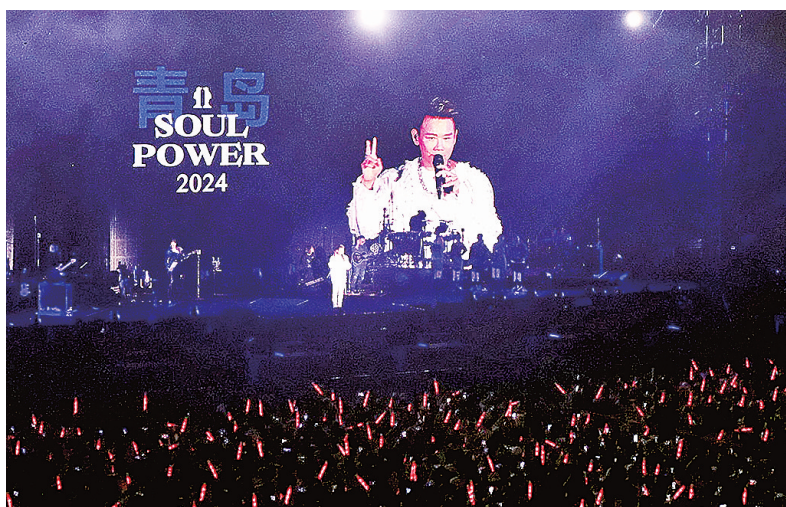
■陶喆演唱会吸引了众多观众“跨城观演”。

从山麓到海滨,青岛已经渐次敛成一卷冬日的童话。在青岛,四季的转场像是一段圆舞曲,人们在瞬间的定格里回味上一个季节的余韵,同时感受这个城市恒久的部分:音乐、啤酒、海滩、大地与海的往复恒动,感慨这2024年最好的时光。这个2024,青岛的多元、奔放、随性超出了人们的预期,市民成为自家城市的“旅客”,身在青岛,感受四季的精彩。