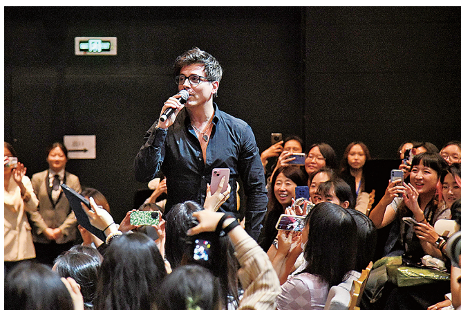
■《摇滚莫扎特》主演在见面会上与青岛乐迷互动。