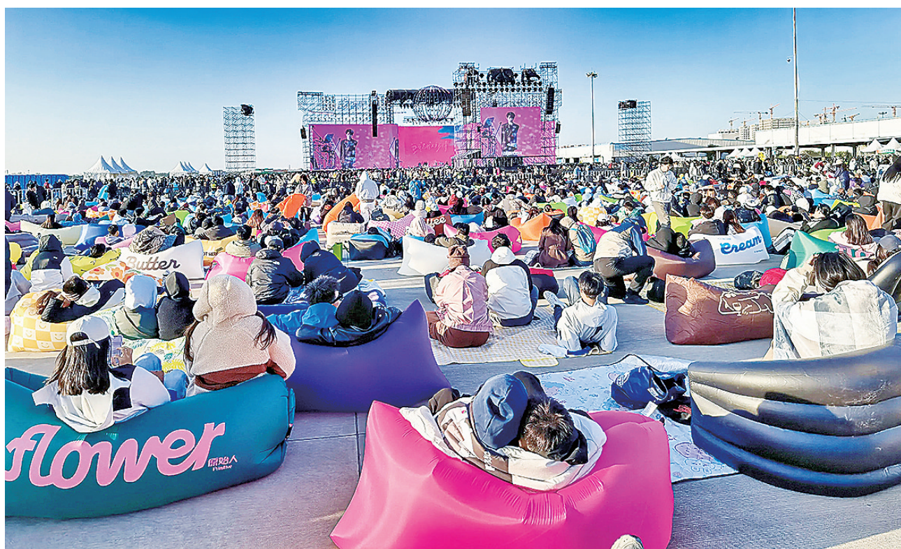
■初冬时节,流亭机场停机坪举办的“汽水星球音乐节”热度不减。