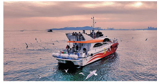
欢快的鸥群环绕着海上游船飞翔，好似与甲板上的游客“捉迷藏”。