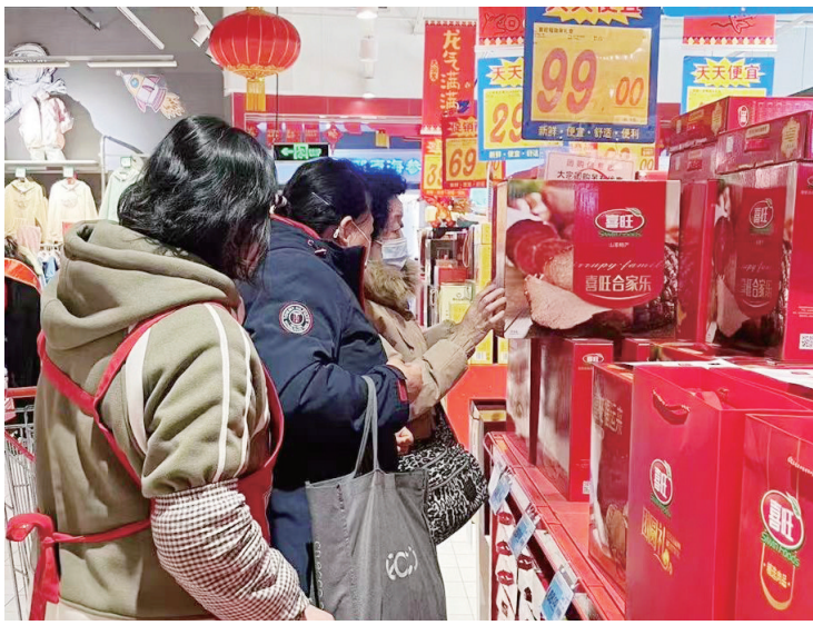
◀消费者在选购喜旺礼盒。

可实验室”等科研平台,与中国肉类食品综合研究中心、南京农业大学、中国农业大学等十余家科研院校、院所联合承担了国家“十一五”“十二五”“十三五”等重点研发计划项目,获授权专利190余项,主导或参与了近20项