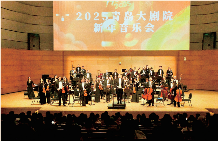
■12月31日晚, 青岛大剧院音乐厅上演由奥地利维也纳之声交响乐团带来的《2025新年音乐会》。

据大鲍岛运营方相关负责人介绍, 为做强“冬游青岛”, 自元旦开始, 大鲍岛将陆续推出街头文化艺术节、跨年livehouse、新中式打击乐主题音乐会、萝卜·元宵·糖球会等系列活动, 涵盖46场主题活动、160场小型活动, 让市民游客沉浸式游逛老城, 体味“最青岛”的年味。