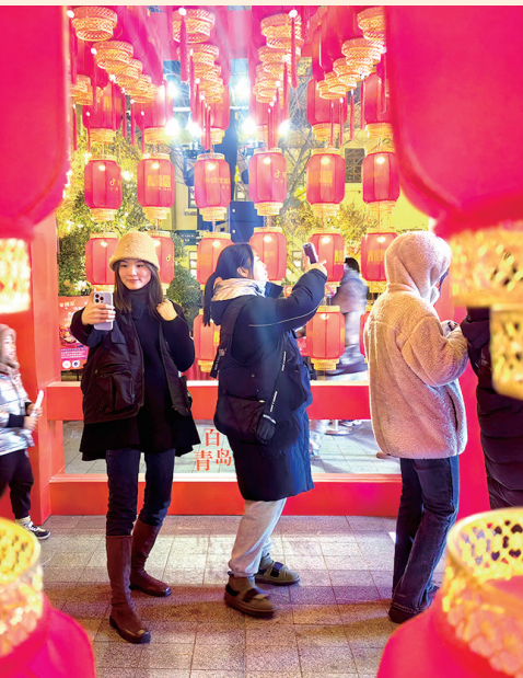
▲12月31日跨年夜, 青岛历史城区精彩纷呈, 上演不眠夜。图为海泊路上节日氛围浓厚。