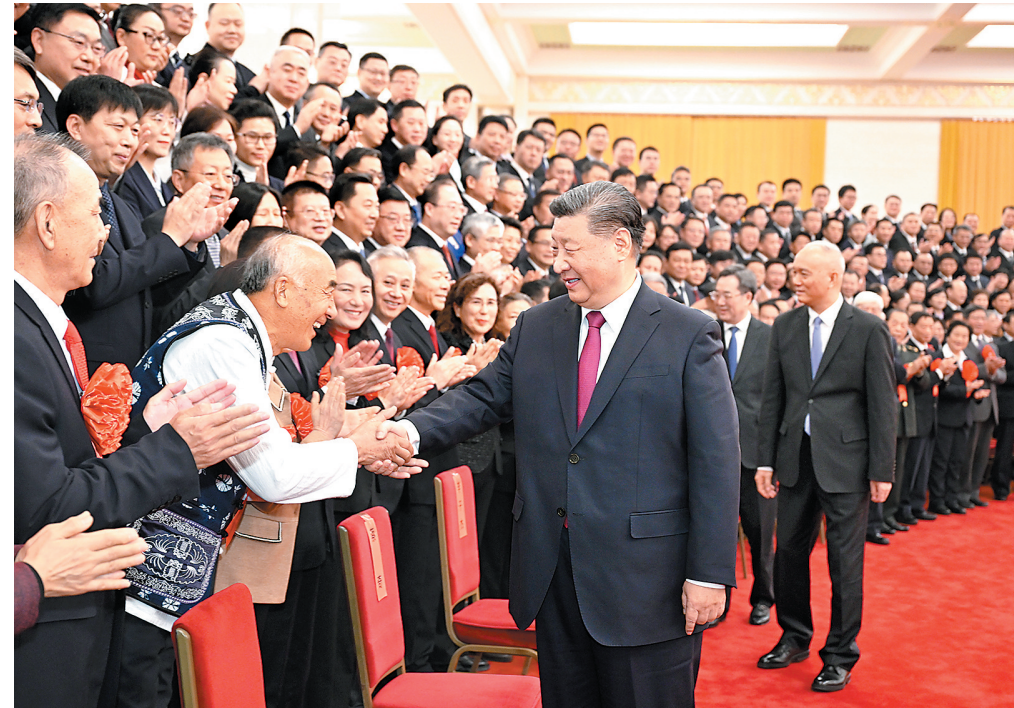
12月31日，党和国家领导人习近平、蔡奇、丁薛祥等在北京人民大会堂接见全国离退休干部先进集体和先进个人受表彰代表。

新华社北京12月31日电 中共中央总书记、国家主席、中央军委主席习近平31日上午在北京人民大会堂亲切接见全国离退休干部先进集体和先进个人受表彰代表，向他们表示热烈祝贺，希望他们弘扬光荣传统、永葆政治本色，继续为以中国式现代化全面推进强国建设、民族复兴伟业作出积极贡献。