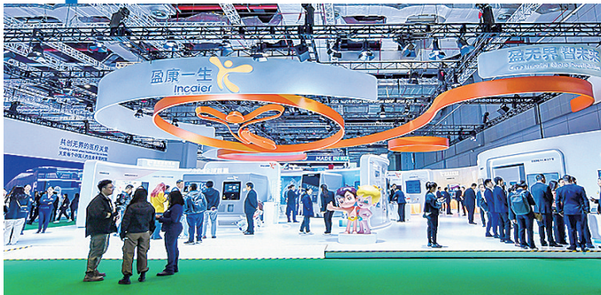
■海尔大健康品牌盈康一生连续5年亮相进博会。

从1991年海尔大规模进军国际市场开始，从欧美市场，再到东南亚市场、中东非市场，海尔不断开启投