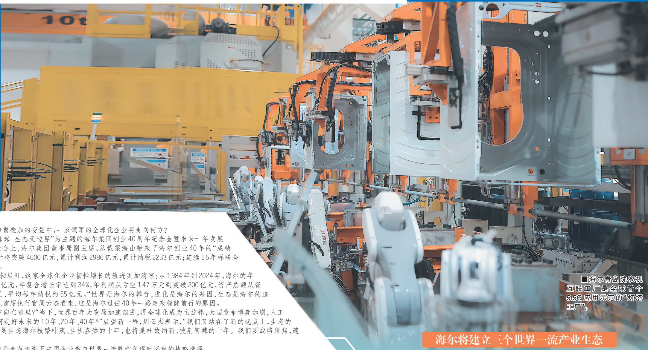
■海尔青岛洗衣机互联工厂是全球首个5.5G应用示范的“灯塔工厂”。