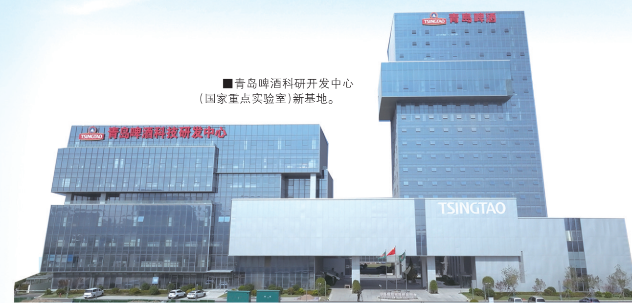
■青岛啤酒科研开发中心(国家重点实验室)新基地。