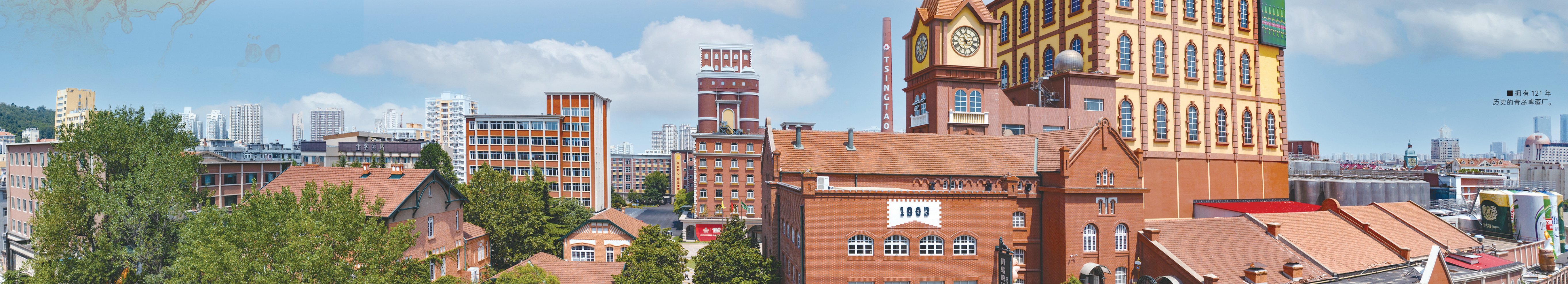
■拥有121年历史的青岛啤酒厂。