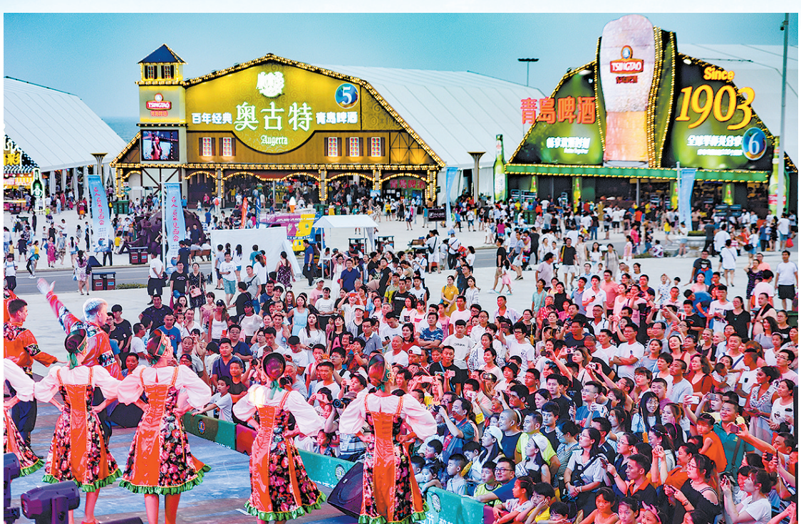
■每年遍布全国100多场次的青岛啤酒节。