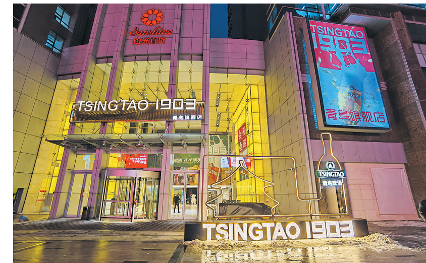
■青岛啤酒遍布全国的200多家时尚酒吧,打造沉浸式体验新场景。