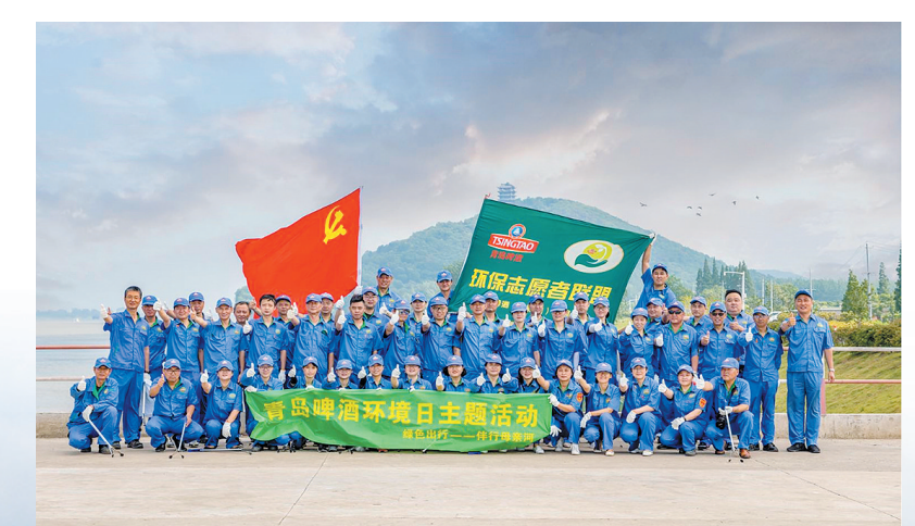
■青岛啤酒秉承“为了更美好的世界”的环境理念,履责担当,践行国企责任。

成功的创新者并非一蹴而就,它们总是有迹可循——深耕自己的核心领域,不断定义开拓新的边界,精进不休、创新不止,在急速变化的市场环境中保持竞争力。