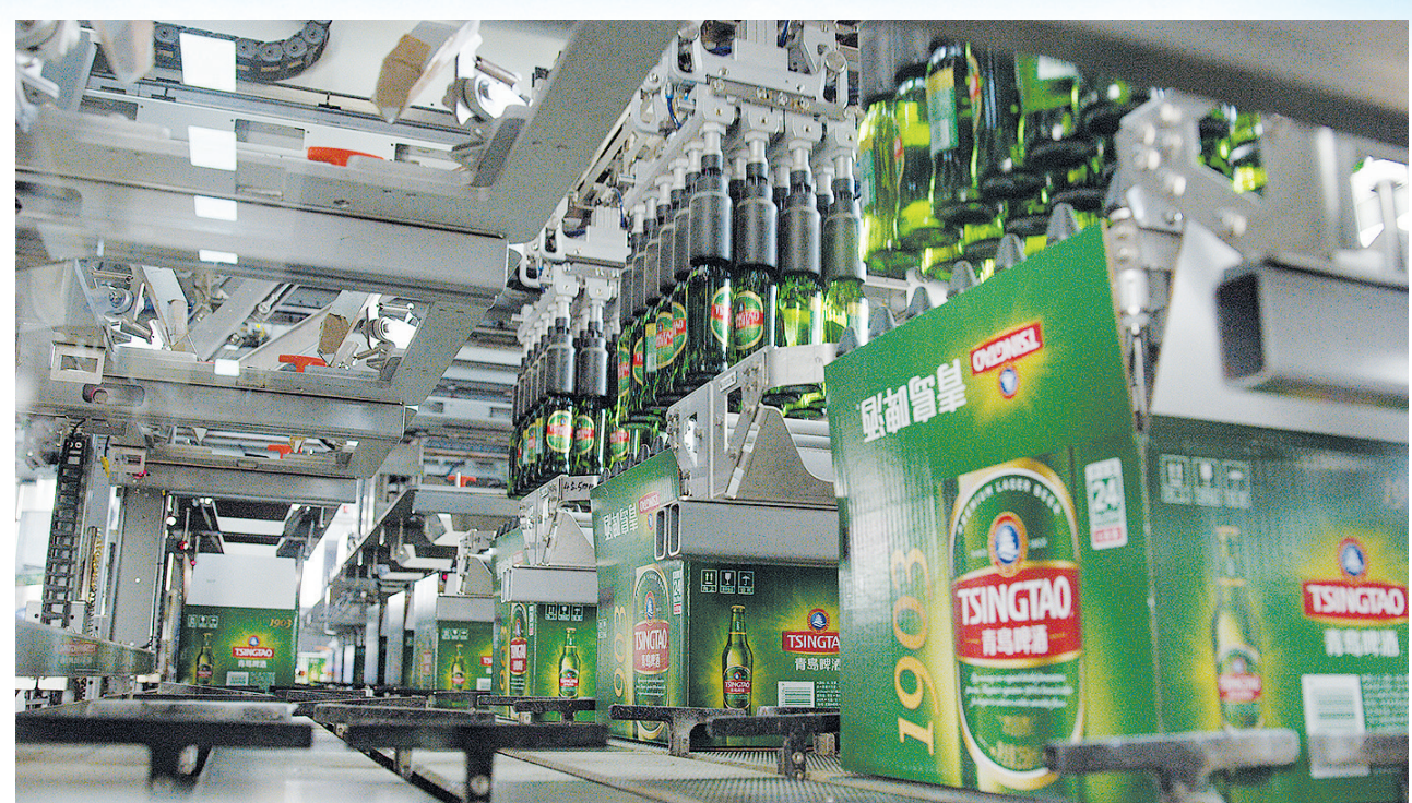
■青岛啤酒“可持续灯塔工厂”智能化生产线,生产出各种特色化啤酒。