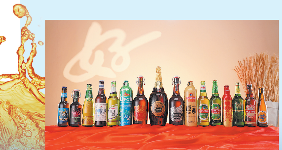
■青岛啤酒产品矩阵,满足消费者品质化、多元化、特色化、场景化需求。

从“最传统”到“最现代”,从“更智能”到“更绿色”,百年青啤在实现华丽转身的同时,也以其“引领型”创新实践,为产业强市注入新动能。