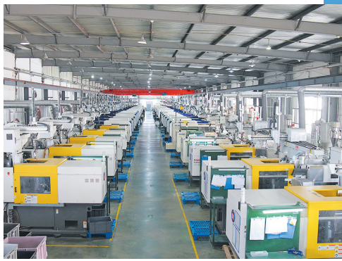
■点石文具现代化生产车间。

潮平两岸阔，风正一帆悬。面向新征程，点石文具将继续深耕主业，专注创新，加压奋进，用五彩之笔描绘更加美好的明天。