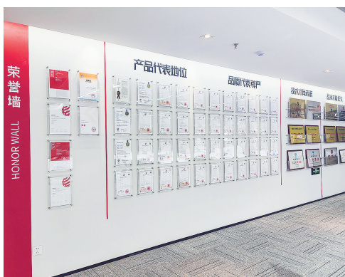
■点石文具收获诸多荣誉。