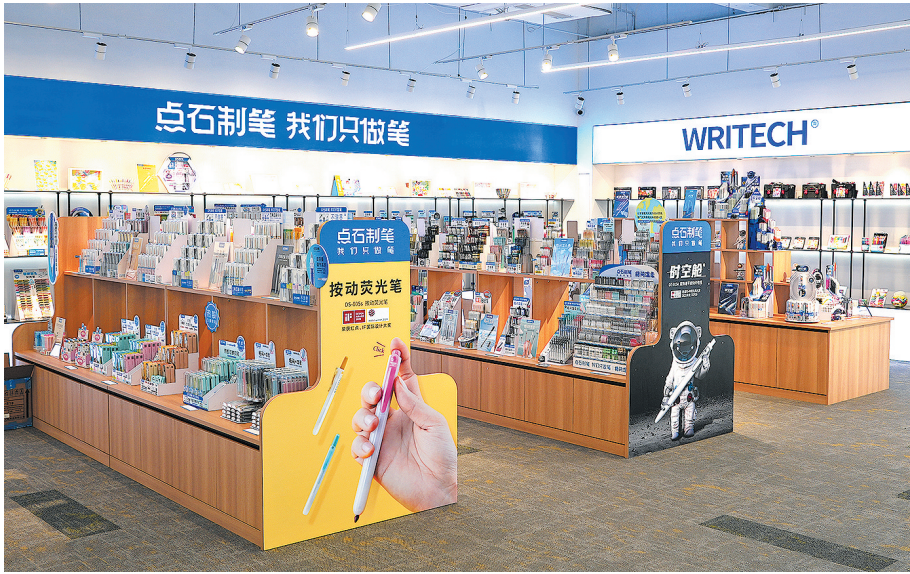
■点石文具产品琳琅满目。

在点石文具推出按动式荧光笔之前，国内市场上的荧光笔几乎都为拔帽式，存在笔帽容易丢失、单手使用不便的问题。针对这个市场痛点，点石文具研