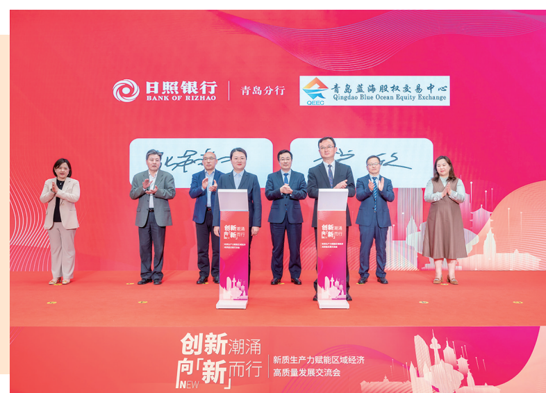
“创新潮涌, 向‘新’而行”新质生产力赋能区域经济高质量发展交流会。

随着银行同业同质化竞争日益加剧, 在“金融+科技”融合创新趋势下, 客户对金融信贷的获得感及便捷性要求进一步提高。2024年, 日照银行青岛分行在农产品交易市场及仓储行业走访中, 了解到农产品生产收购及交易环节的融资困境, 积极协调总行, 推出“水善易贷”农产品电子仓单质押场景金