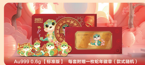
Au999 0.6g【标准版】 每套附赠一枚蛇年徽章(款式随机)

今年特别设计蛇年新春限定徽章, 分别以“金榜题名”、“事事如意”、“大吉大利”、“四季平安”为主题, 满足佩戴、收藏多种功能, 祝好运随身, 让祝福随行。【标准版】压岁钱每套均附赠一枚蛇年徽章, 四款徽章以盲盒形式随机出现, 更有4套装【小礼包】版本, 好玩好看、寓意美好的4款蛇年新春主题徽章一次集齐。